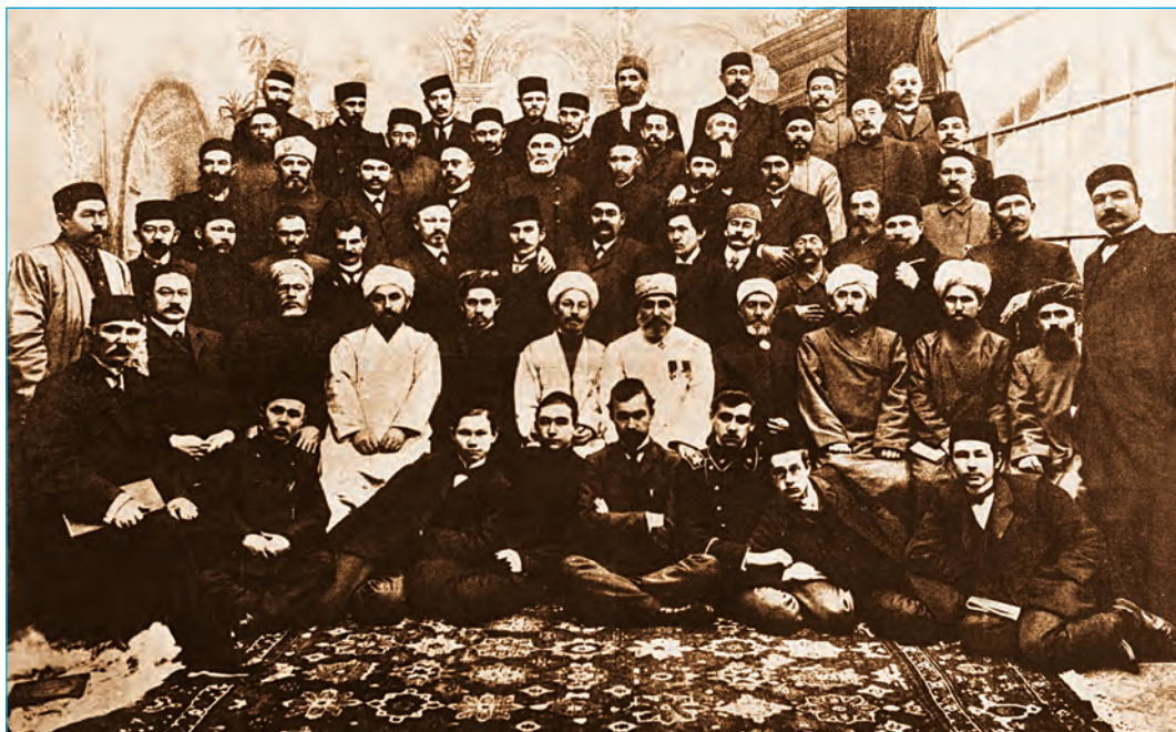
Бутумроссия мусулмонларининг Петербургдаги қурултойи иштирокчилари. 1906 йил.