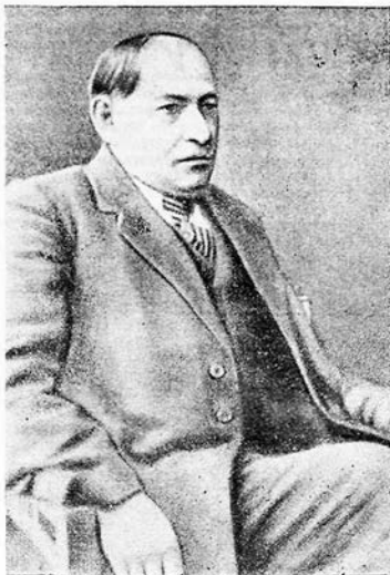
Н. Н. Нариманов.

мунистической партии и Советского государства Наримана Наджаф-оглы Нариманова (1871—1925). Он был не только крупным партийным и государственным деятелем, но и талантливым писателем, драматургом.