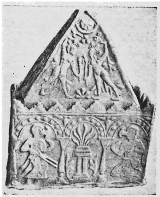
Рис. 1. Общий вид оссуария из Муллакурмана.

Второй оссуарий 2 — прямоугольный (52×25×34 см), с пирамидальной крышкой (46×20×39 см) — сохранился полностью (рис. 1). Он сделан из хорошо обожженной глины, черепок в изломе розовый. Общая высота оссуария с крышкой — 73 см. На внутренней стороне, вверху, выступает полочка для крышки (ш — 2,5 см). По бокам крышки, в нижней части, сделано по одному круглому сквозному отверстию (д=2 см). Все стенки крышки и самого оссуария изготовлены отдельно и соединены между собой при помощи глиняных валиков. Четыре стенки оссуария и крышка украшены рельефными изображениями. Стенки увенчаны ступенчатыми (два-четыре уступа) и треугольными зубцами. Рельефные изображения выполнены оттиском с двух одностворчатых матриц. Одна из них — прямоугольная — использовалась для украшения оссуария, а другая — треугольная — крышки. На узких боковых стенках и крышке оттиснута лишь часть рисунка.