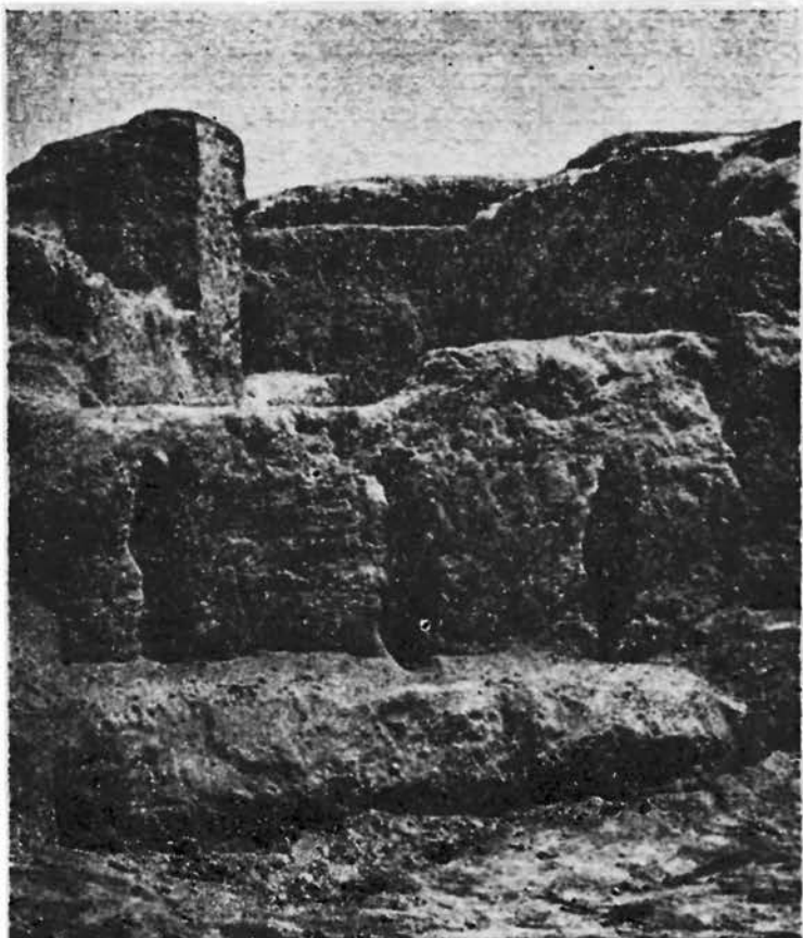
Рис. 2. Городище Шаштепа. Фасад здания II—III вв. до н. э., украшенный стреловидными прорезями.

Строительные приемы: устройство сводчатых коридоров и характер сводов, арки, окна, стреловидные прорезы, примеры окраски интерьеров также заставляют обратиться к кругу памятников последней трети I тыс. до н. э. в низовьях Сырдарьи, включая городища Чирик-Рабат и Бабиш-Мулла.