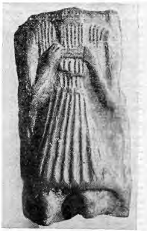
Рис. 3. Музыкант с многоствольной флейтой.

гольным лицом и короткой стрижкой. Волосы, видимо, зачесаны назад и переданы рельефными параллельными линиями. Уши заострены. Брови и нос соединены в виде Т-образной выпуклости. Глаза — круглые налепы, с едва заметным рельефным зрачком (на уцелевшем правом). Под припухлыми, собранными в узелок губами, музыкант держит, направив вправо от себя, поперечную флейту с небольшим наклоном вниз. Руки согнуты в локтях. Кисть левой руки чуть выше правого плеча, повернута ладонью внутрь. Правая рука отставлена вправо и ее кисть, ладонью наружу, находится по уровню немного ниже кисти левой руки. На правой половине груди видны четыре выпуклые параллельные линии, по всей вероятности передающие складки одежды.