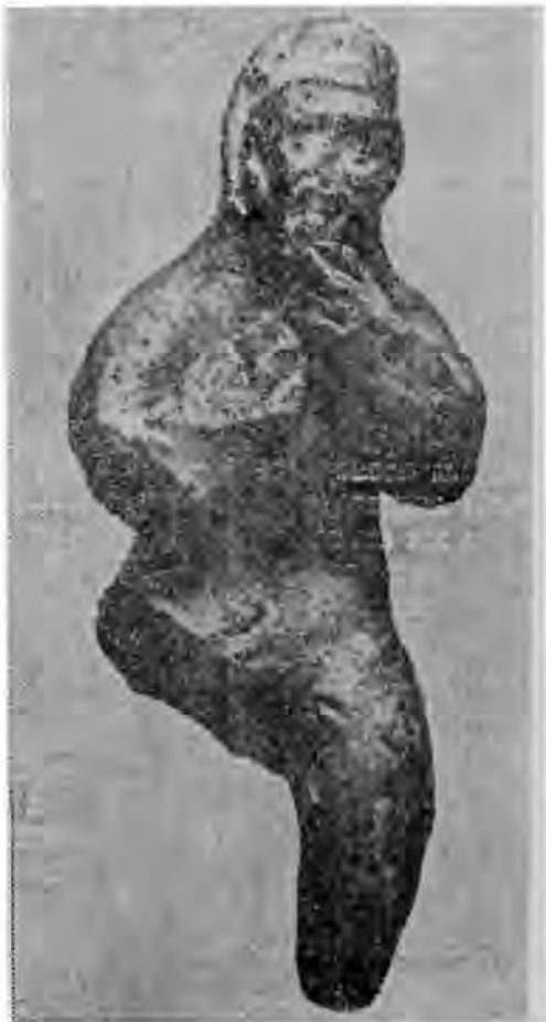
Рис. 1. Музыкант с продольной флейтой.

Однако прямой и самой близкой аналогией по технике изготовления кампыртепинскому флейтисту является найденная на этой же цитадели в коридоре I, в слоях I—II вв. н. э., полностью лепная скульптура нагого бородатого Силеня с козыми ногами 10 . Это сходство допускает возможность их изготовления одним мастером. Тела полностью идентичны, только у флейтиста голова штампованная,