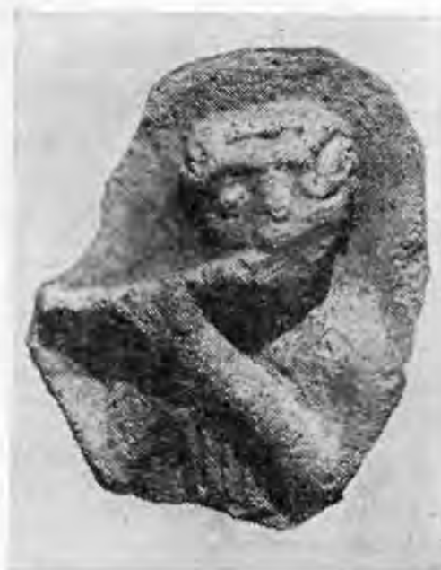
Рис. 2. Музыкант с поперечной флейтой.

Сохранившаяся верхняя часть статуэтки передает изображение юноши с треу-