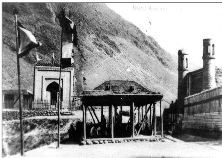
Шоҳимардондаги Шоҳи Толиб зиёратгоҳи. XX аср бошида олинган сурат.

мозор тиклаганлиги тўғрисида ҳам худди «Тазкираи ҳафт Муҳаммадон» сингари бирон бир асар мавжуд бўлганлиги эҳтимолдан холи эмас. Балки шу боис маҳаллий аҳоли Шоҳи Толиб Сармаст тўғрисидаги ривоятни Шоҳимардон қишлоғидаги Ҳазрат Али мазорига нисбатан берган бўлсалар керак.