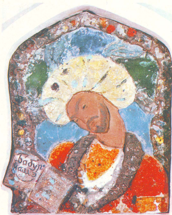
Бобур портрети. Шамот. Автор Р. Авекян. Портрет Бабура. Шамот. Автор Р. Авекян.