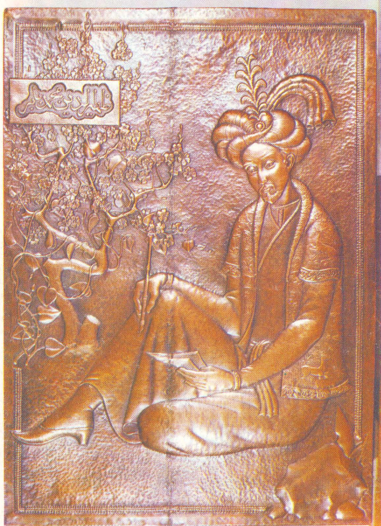
Бобур портрети. Чеканка. Автор О. Азизов. Портрет Бабура. Чеканка. Автор О. Азизов.

ИНСТИТУТ РУКОПИСЕЙ АКАДЕМИИ НАУК УЗБЕКСКОЙ ССР