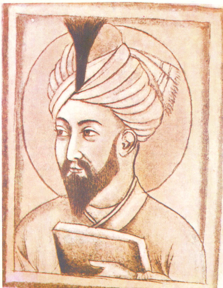
«Бобур портрети» миниатюрасидан фотонусха. Фотокопия с миниатюры «Портрет Бабура».