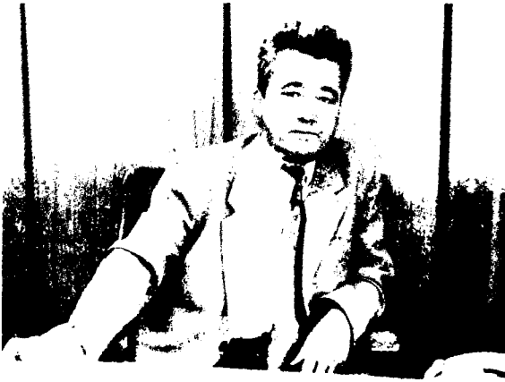
Омон Матжон Ўзбекистон халқ шоири