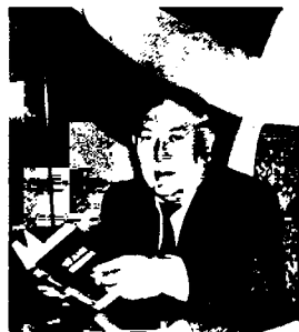
Тўлан Низом, Ўзбекистон халқ шоири