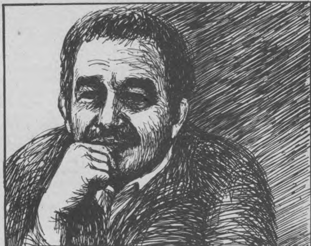
Габриэль Гарсиа Маркес