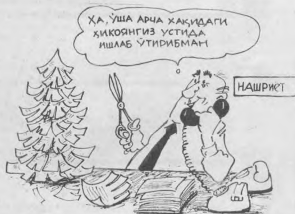
Расом Ҳ. Содиқов