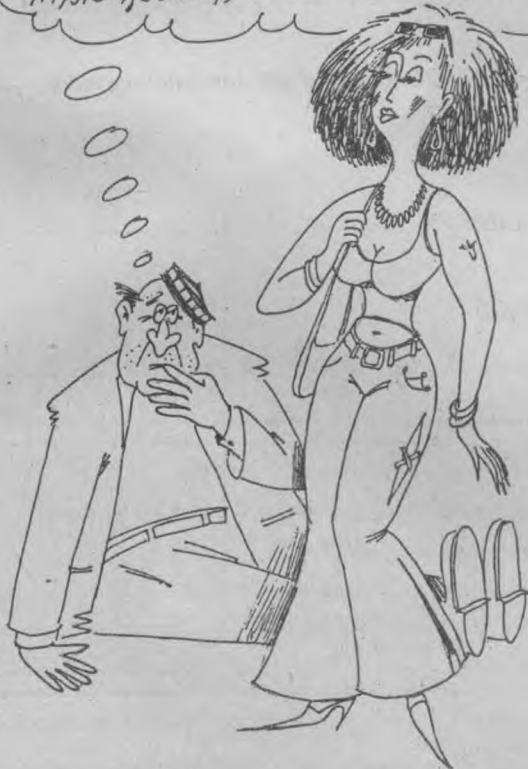
Расмлари Шавкат МУЗАФФАР чизган.

Эр хотинга ҳасрат қилди: - Ўзимизни шунча вақтимиз етлаётгандай, ҳулар қўшимиз лотореяга машина ютиб олибди.