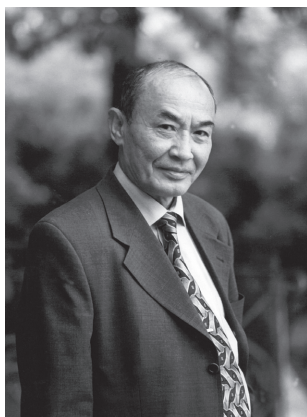
Абдулла ОРИПОВ, Ўзбекистон Қаҳрамони, Халқ шоири