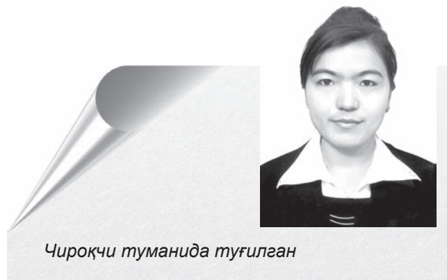
Чироқчи туманида туғилган