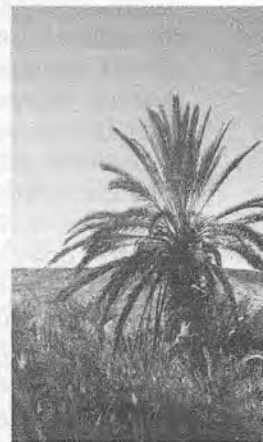
Арабчадан Заҳириддин таржимаси

Аллоҳ таолодан доимо афв-мағфират, яхши кайфият ва соғлиқ-омонлик сўраб дуо қил.