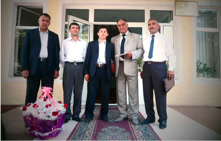
Ҳидоятулло Раҳмонийнинг 60-йиллигида