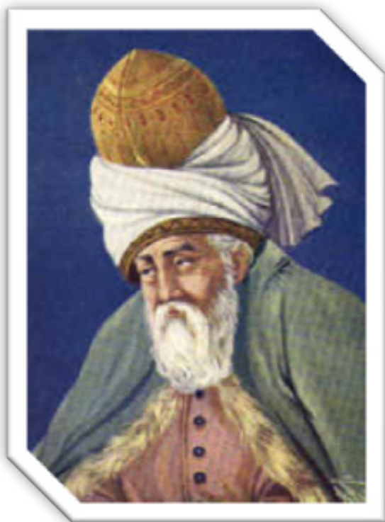
Мавлоно Жалолиддин Румийдан