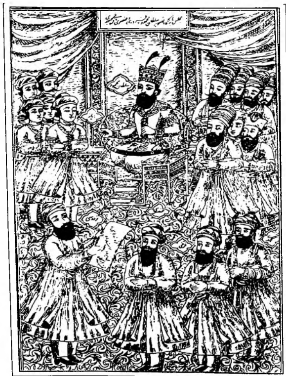
Литографическая гравюра к книге «Шохномаи туркий». Ташкент

что подчиненным азиатам мы дали мир и спокойствие. Однако существует ещё более великое чувство — это нация и её национальная гордость. Мы должны понять состояние мусульман. Политическая смерть — тяжела, но ещё горше — смерть национальная. При нашем господстве они чувствовали себя именно так. Хватит, раз так, не стоит удивляться, если против нашего господству поднимется бунт. Есть такие национальные интересы, которые, независимо от того, голодает народ или нет, в конце концов, готовы проявить себя».