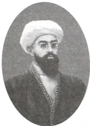
Выдающийся просветитель Махмудхужа Бехбудий

Несмотря на то, что обращение печаталось в каждом номере, статей и информации с мест поступало мало. Переживая, Бехбудий пишет статью «На учун илтифот этмайдурлар?» («Почему оставляют без внимания?»): «...Неужели наши надежды не оправдаются, оказались пустыми. «Самарқанд» выходит в свет уже пятый месяц. За это время не обратили внимание на национальную газету, на национальную службу 1 . Действительно, обида Бехбудий была не беспочвенной. Он хотел, чтобы интеллигенция писала в газету, высказывала свои мысли и чаяния, давала оценку событиям, возбуждала сознание. Однако отсталая среда, глухота от колонизации, без-