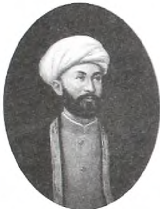
Просветитель Исхокхон Ибрат