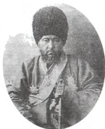
Мухаммад Рахимхон II – Феруз

за национальное освобождение противостояли этим идеям и целям царского правительства.