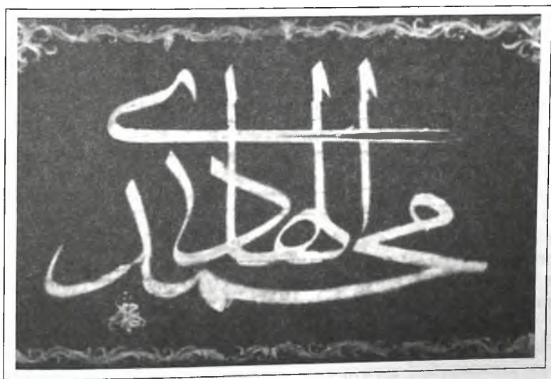
Образец каллиграфического искусства средних веков. Художественное оформление произведения «Равзат ус-сафо». Бухара, XVI век

«Сейчас, в период формирования идеи национального развития, разработки основных его понятий и принципов, средства массовой информации играют большую роль в формировании общественного мнения, внедрения в сознание народа, особенно молодого поколения, идеологии национальной независимости. Они — самые эффективные средства, отражающие процесс духовно-просветительского реформирования, проблемы, возникающие в этот период, различные грани общественной жизни.