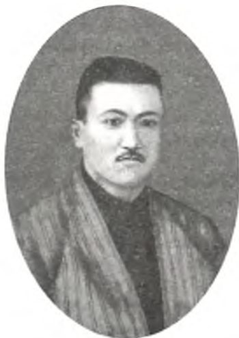
Великий писатель и журналист Абдулла Кадырий

Молодой литератор, поднимая вопрос национального возрождения, следовал, конечно, за Авлоний и Тавалло, но вместе с тем, это стихотворение свидетельствует об очень серьезной способности автора. Возможно, в художественном отношении стихотворение имеет некоторые слабости, однако, давайте, обратим внимание на основную цель и художественный метод, которые поставил перед собой поэт. Основное ударение он ставит на слова «наш народ» и старается усилить значение этих слов художественными средствами. По этой причине иногда законы рифмованности нарушаются, но поэт, следуя своей цели, повторяет снова и снова одни и те же слова, что в поэзии вполне приемлемо.