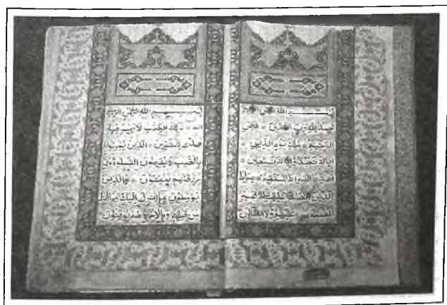
Рукописный образец Корана

Необходимо также сказать, что разработанные татарским