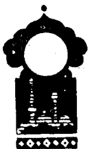
Тўрт юз элликни тўлди- рувчи кеча

Қисса шу ерга етганда табиб Шохриод ва Шаҳризод ҳикоя айтишни тўхтатди.