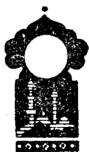
Тўрт юз эллик олтинчи кеча

Қисса шу ерга етганда тонг отди ва Шаҳризод ҳикоя айтишни тўхтатди.