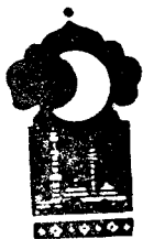
Тўрт юз саксон бешинчи кеча

Қисса шу ерга етганда тонг отди ва Шаҳризод ҳикоя айтишни тўхтатди.