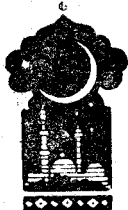
Беш юз тўқсон олтинчи кеча

Қисса шу ерга етганда тонг отди, Шаҳризод ҳикоя айтишни тўхтатди.