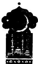
Тўрт юз етмиш учинчи кеча

Қисса шу ерга етганда тонг отди ва Шаҳризод ҳикоя айтишни тўхтатди.