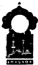
Олти юзни шўлдирувчи кеча

Қисса шу ерга етганда тонг отди, Шаҳризод ҳикоя айтишни тўхтатди.