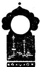
Беш юз олтмиш тўққизинчи кеча