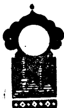
Беш юз эллик учинчи кеча

Қисса шу ерга етганда тонг отди ва Шаҳризод ҳикоя айтишни тўхтатди.