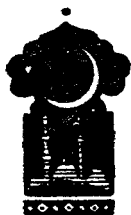
Беш юз учинчи кеча

Қисса шу ерга етганда тонг отди ва Шаҳризод ҳикоя айтишни тўхтатди.