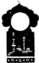
Тўрт юз етмиш ишканчи кеча

Қисса шу ерга етганда тонг отди ва Шаҳризод ҳикоя айтишни тўхтатди.