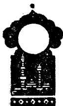
Беш юз ўттиз иккинчи кеча

Қисса шу ерга етганда тонг отди, Шаҳризод ҳикоя айтишни тўхтатди.