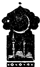
Тўрт юз саксон учинчи кеча

Қисса шу ерга етганда тонг отди ва Шаҳризод ҳикоя айтишни тўхтатди.