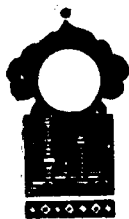
Беш юз ўттиз олтинчи кеча

Қисса шу ерга етганда тонг отди ва Шаҳризод ҳикоя айтишни тўхтатди.