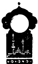
Беш юз тўқсонни тўлдирувчи кеча

Қисса шу ерга етганда тонг отди, Шаҳризод ҳикоя айтишни тўхтатди.