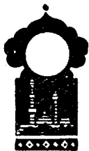
Беш юз олтмиш биринчи кеча

Қисса шу ерга етганда тонг отди ва Шаҳризод ҳикоя айтишни тўхтатди.