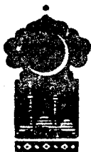
Олти юз тўртинчи кеча

Қисса шу ерга етганда тонг отди, Шаҳризод ҳикоя айтишни тўхтатди.