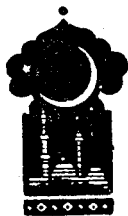
Беш юз ўттиз саккизинчи кеча

Қисса шу ерга етганда тонг отди ва Шаҳризод ҳикоя айтишни тўхтатди.