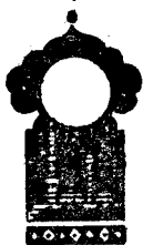
Беш юз эллик еттинчи кеча