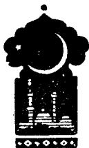
Беш юз етмиш саккизинчи кеча

Қисса шу ерга етганда тонг отди, Шаҳризод ҳикоя айтишни тўхтатди.