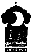
Тўрт юз эллик бешинчи кеча

Қисса шу ерга етганда тонг отди ва Шаҳризод ҳикоя айтишни тўхтатди.