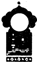
Беш юз ўттиз еттинчи кеча

Қисса шу ерга етганда тонг отди ва Шаҳризод ҳикоя айтишни тўхтатди.