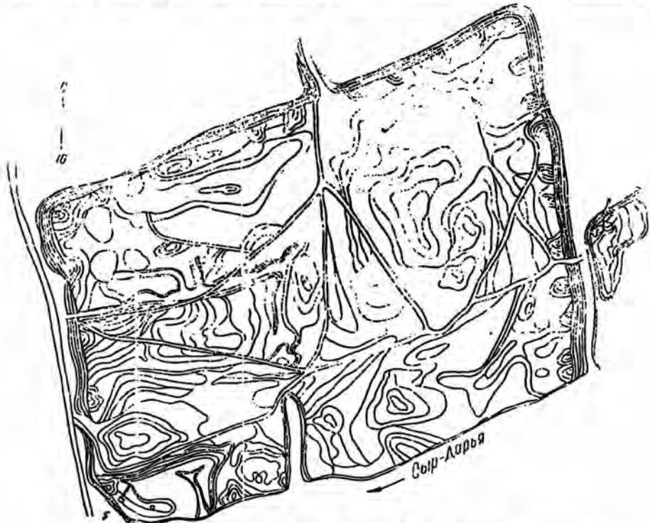
Рис. 1. Схематический план шахристана на городище Ахсыкет.

Остальная часть территории внутри обвода представляет собой в основном ровную поверхность, и лишь кое-где еле заметны небольшие тепе. Подъемные и раскопочные материалы (фрагменты поливной керамики, жженных кирпичей, монеты и др.) свидетельствуют о том, что данный район