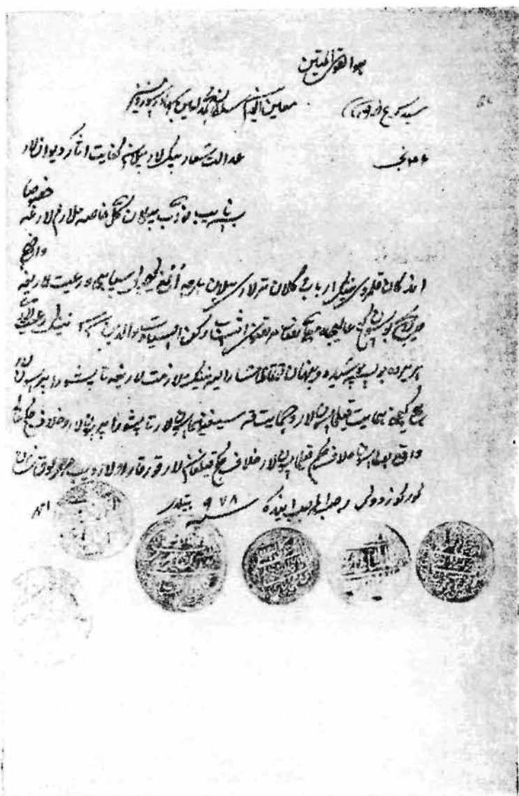
Қочоқ деҳқонларни яширган шахсларни жазолаш ва уларни аввалги яшаш жойига қайтариш ҳақидаги 119/46 рақамли ёрлиқ.

тилган эди» 17 . В. В. Бартольднинг шогирди марҳум проф. А. Ю. Якубовский ҳам ўрта асрларда Кичик ва Ўрта Осиёда деҳқонларни ерга бириктириш ҳоллари бўлган, деган фикрга келган бўлса ҳам, бу