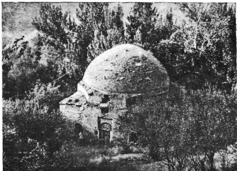
Мечеть Мир Саид Халиля в Багимазаре.

зарсай. Вокруг мечети в густых лесных насаждениях по берегам сая расположено старинное кладбище с многочисленными мраморными надгробиями 3 .