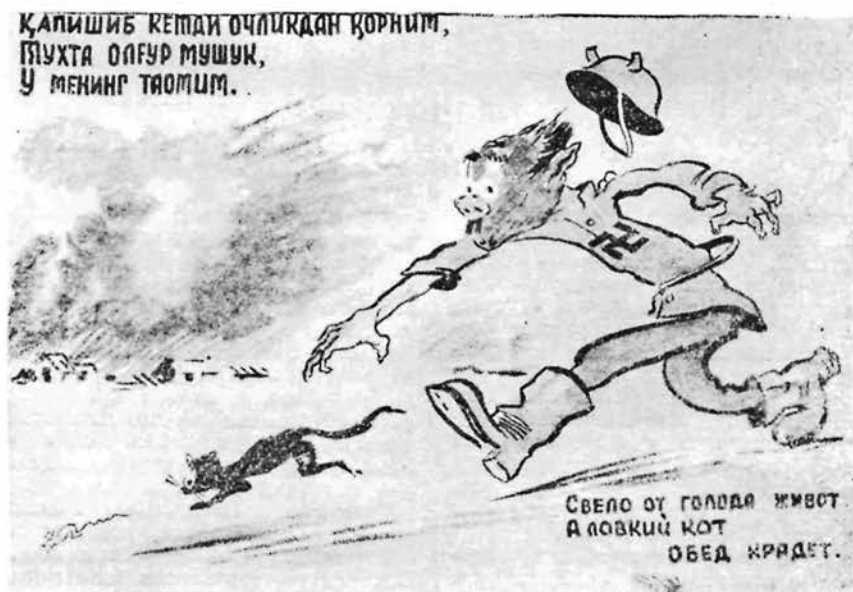
Агитплакат художника Г. Н. Карлова. Светокопия. 58×65 см. Август 1941 г.