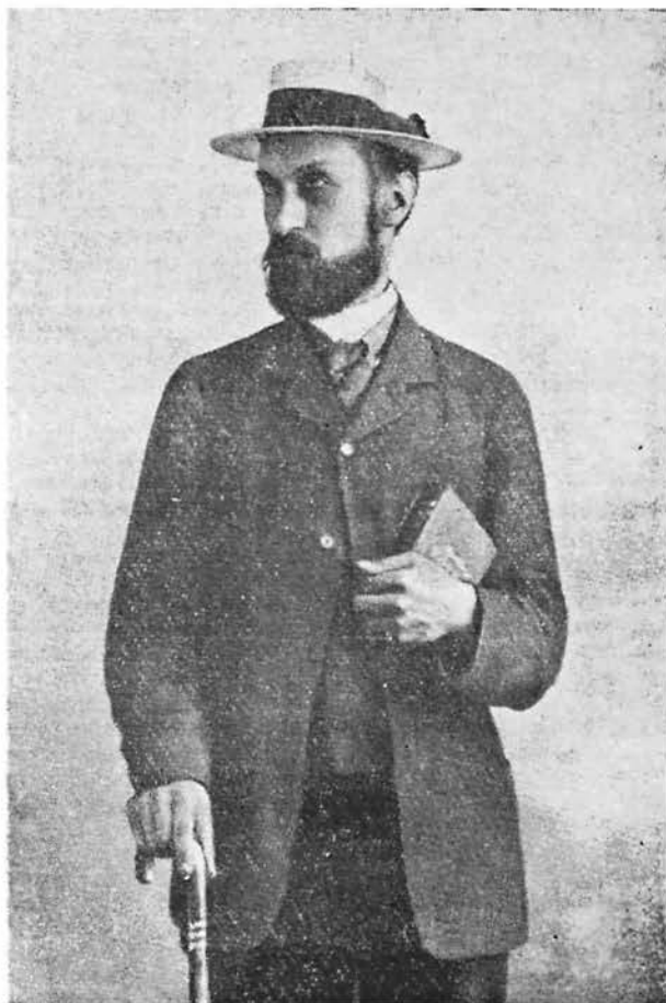
Василий Владимирович Бартольд. 90-е годы XIX в.

ной ненавистью к пришельцам, приносившим с собой господство чужого народа, чужой веры и культуры».