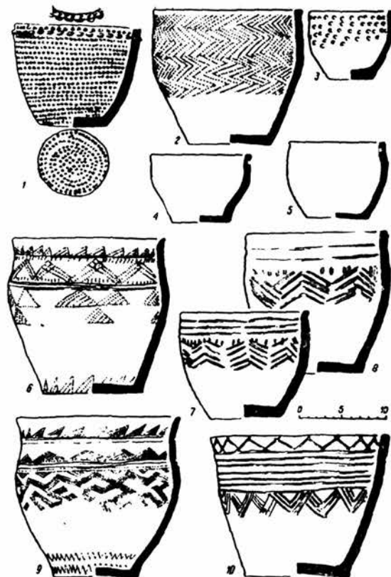
Рис. 2. Глиняные сосуды из могильников близ сел. Батени.

1—Ярки III (могила 3); 2—5—Ярки I; 6—10—Ярки II.