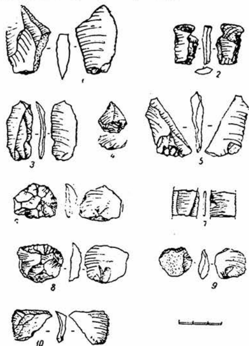
Рис. 2. Кремневые изделия из района строительства Чарвакской ГЭС.

При раскопках средневековой гончарной мастерской на Ходаваттепа, у сел. Богустан, найден один обломок тонкой ножевидной пластинки с тремя гранями