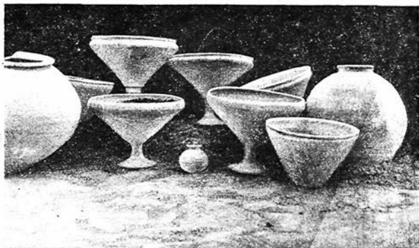
Рис. 2. Образцы керамики из Сапалитена.

Жилые комнаты чаще всего оформлены пристенными очагами с узким дымоходом квадратной или прямоугольной формы. В некоторых комнатах имеются невысокие суфы из сырцового кирпича, обычно занимающие треть комнаты. В одном из углов или с края от суфы стоят большие хумы, нижняя часть которых врыта в землю, а верхняя до горла тщательно обмазана слоем глины с примесью самана.