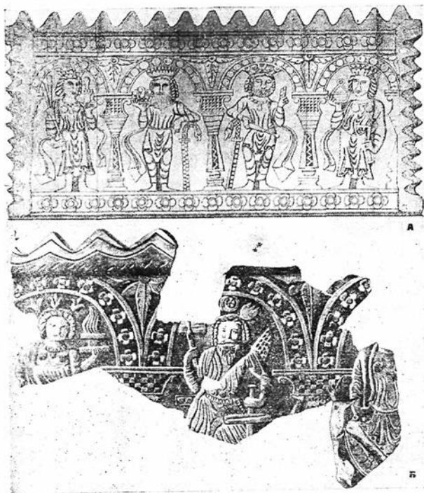
Рис. 2. Реконструкции лицевых стенок оссуариев из Бия-Наймана, выполненные по фрагментам Б. Н. Кастальским (А) и Л. И. Ремпелем (Б).

рошо известны, как характерные для согдийского чекана VI—VII вв. 7 ; с этой датировкой в полной мере согласуются и иконографические особенности рельефов.