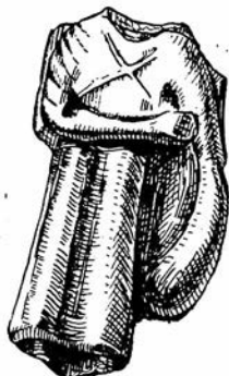
Рис. 3. Статуэтка мужчины.

античной Средней Азии, в том числе Бактрии. Свообразны положение рук, костюмы, атрибуты. Однако их объединяет общая композиция, продиктованная временем. Статуэтки выполнены строго по канону фронтальности. Пропорции фигур построены симметрично, скважины и неподвижны, что свойственно изображениям, несущим иератический характер. Сейчас трудно объяснить, чем вызвано кардинальное отличие мирзакултепских статуэток от известных нам среднеазиатских — этническими особенностями или религиозными воззрениями. Отсутствие голов у всех фигурок еще более усложняет разрешение этого вопроса. Тем не менее они представляют огромный интерес для истории изобразительного искусства; благодаря им стали известны новые образы чтимых божеств с соответствующими религиозными воззрениями, символами и эстетическими взглядами.