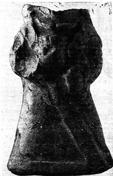
Рис. 2. Статуэтка богини.

Видимо, на мирзакултепинских статуэтках запечатлен процесс эволюции образа богини с кубком и инвентурным кольцом на стадии перехода от докушанского времени к кушанскому. Различие в одеянии, с одной стороны, очевидно, указывает на усиление в передаче бактрийских богинь местных элементов, а с другой, — на значительные социальные, политические, этнические сдвиги и, следовательно, на изменение идеологических воззрений. Бесспорно, одежда богини из Мирзакултепа местного происхождения и не имеет ничего общего с эллинистической. В последующий, кушанский период образ богини с кубком полностью вытесняется образами богинь в местных одеждах. Среди огромного количества известных нам статуэток кушанского времени пока нет ни одного изображения богини с кубком.