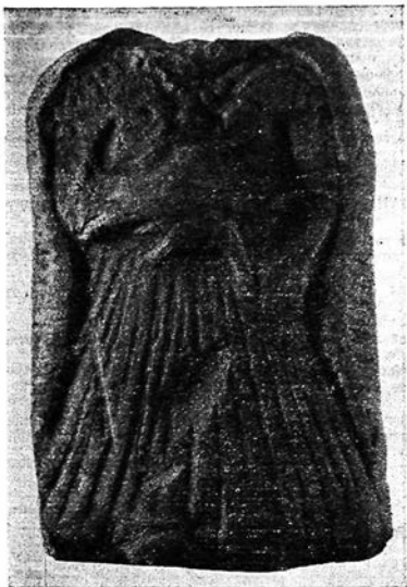
Рис. 1. Статуэтка богини из Мирзакултепа.

ного ангоба. Оттиск объемный, выполнен штампом. Голова утрачена. Длина статуэтки 125 мм, ширина 48—74 мм, толщина 5—27 мм. Бока, нижняя часть и тыльная сторона подрезаны ножом. Тыльная сторона не плоская, как обычно, а имеет глубокое и довольно широкое вертикальное углубление в середине, сделанное, видимо, для уменьшения тяжести статуэтки.