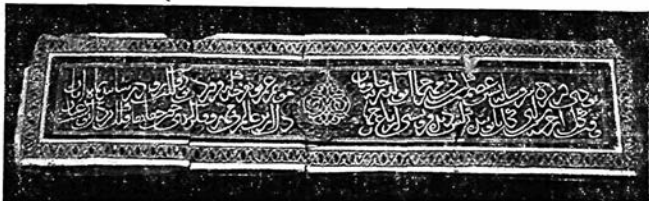
Рис. 1. Общий вид облицовки длинной стороны надгробия с Каджартепа.

В 1967 г. в юго-западном углу городища Каджартепа (или Гулистантепа), в местности Бешкент Кашкадарьинской области УзССР, была обнаружена кирпичная кладка с керамической облицовкой 1 .