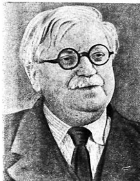
Рис 1. Василий Васильевич Струве.

Разместившись в Ташкенте, Институт стремился по возможности сохранить в основном свою прежнюю структуру, руководствуясь указанием Президиума АН СССР о том, что и в условиях военного времени академические институты должны всемерно развешивать научные работы, направленные к укреплению мощи нашей Родины, оставаться центрами передовой советской науки. В 1942 г. в Институте существовали кабинеты: Дальневосточный, Индийский, Иранский, Семитический,