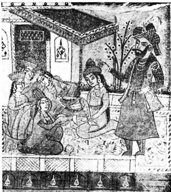
Рис. 2. Разговор Зулейхи с Юсуфом.— «Юсуф и Зулейха» Джамии. Ркп. ИВ АН УзССР, инв. № 5017.

Средневековый стиль миниатюр поздних списков отчетливо про- ступает сквозь скрупулезное соблюдение этикета и тщательное под- черкивание сословной характеристики персонажей. Это те основные мо- менты, которые наряду с сюжетом определяют композиционное по- строение рисунка. Лица высокого сословия помещаются на среднецен- тральном плане, в окружении слуг. Костюмы их богаче и больше оформлены украшениями, чем у других. Иногда они выделяются и бо- лее крупными размерами.