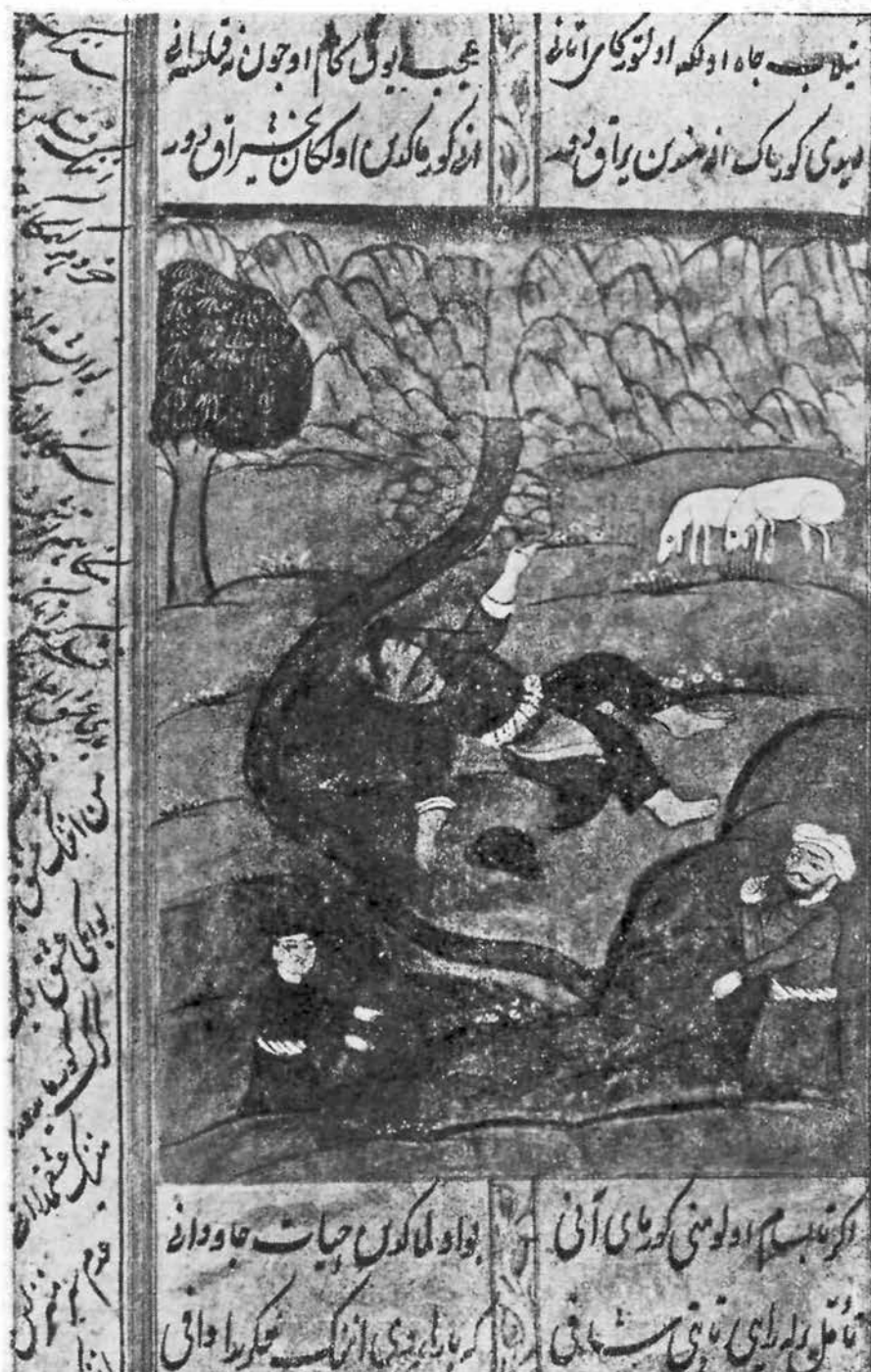
Рис. 1. Смерть Фархада. — «Хамса» А. Навои. Рқп. Института рукописей им. Х. С. Сулейманова АН УзССР, инв. № 23.