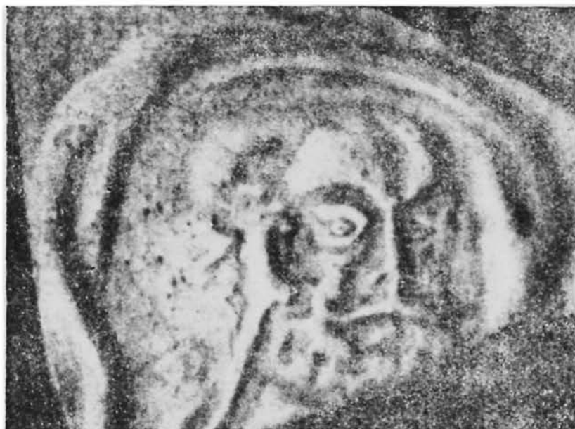
Рис. 2. Тип жителя Ташкента VII—VIII вв. н. э. Оттиск на терракотовой плитке из Актепа Юнусабадского.

В IX в. в регионе постепенно утверждается ислам, но положение его было нестабильно даже в X в. Источники сообщают, что жители Шаша составляли одновременно опору и предмет беспокойства саманидского правительства. Немало сделал для распространения ислама выходец из Шаша шафиитский ученый-богослов Абу Бакр ал-Каффаль ал-Шашин (ум. в 975—977 гг.), могила которого находится в Ташкенте.