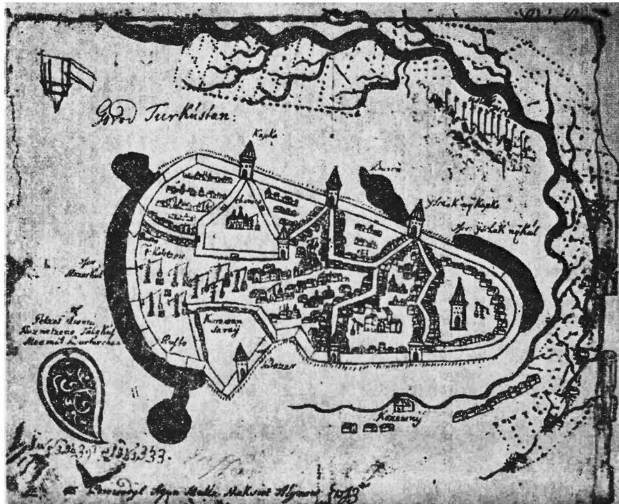
Рис. 2. План г. Туркестана.