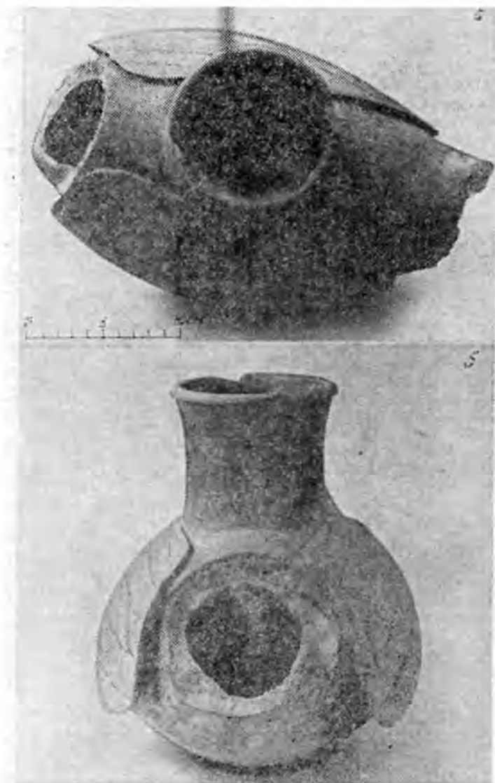
Рис. 1. Зооморфный сосуд из Джаркутана: а — вид сверху, б — вид спереди.

Сосуд довольно крупный, изображен реалистично, но, к сожалению, сохранился не полностью — ножки, голова вместе с шей и хвостовая части отломлены, что несколько затрудняет определение конкретного вида птицы. Судя по характеру тулова, она скорее относится к семейству водоплавающих — утка, гусь (?), но не исключено, что перед нами стилизованный фазан (?) (рис. 1).