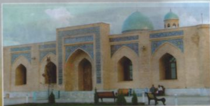
«Чилустун» жомеъ масжиди