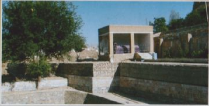
Шайх Абул Ҳасан Нурий мақбараси