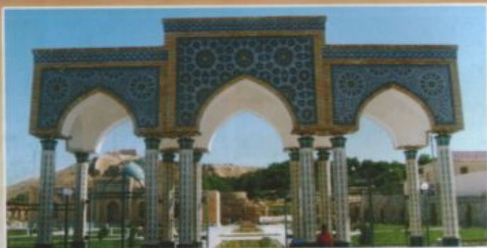
Маъмуанинг кириш жойи