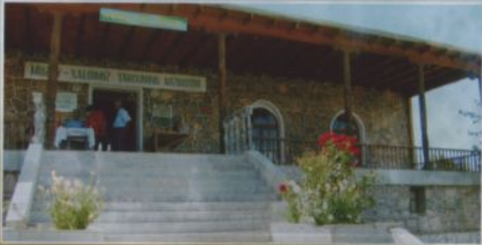
Нурота табиий-меъморий мажмуаси музейи