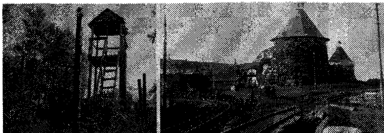
Лагернинг ўрмон зонасидаги кўриқлаш иншооти