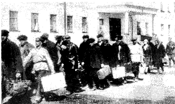
Соловец лагерига янги маҳбусларнинг келиши. 1927 й.

Афсуски, қурилишга оид юқорида келтирилган маълумотлар умумий характерга эга бўлиб, мазкур қурилишда ўзбек миллатига мансуб қанча маҳбус қатнашгану, шулардан қанчаси ҳалок бўлгани аниқ эмас.