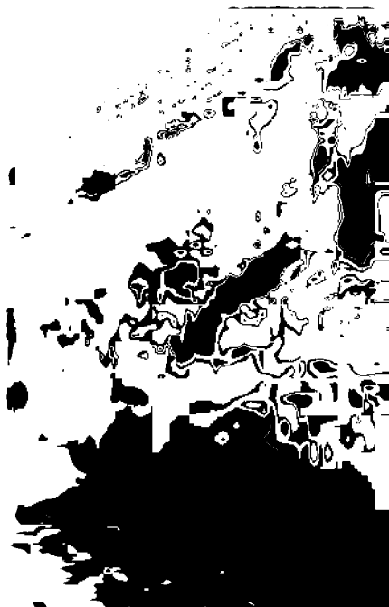
Арк девори қолдиқлари.