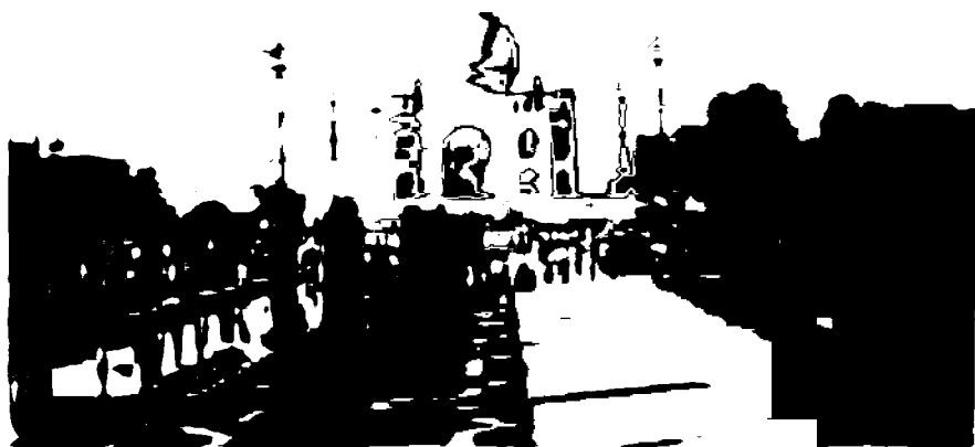
Тожмаҳал. Бобурийлар сулоласидан қолган ажийб ёдгорлик.