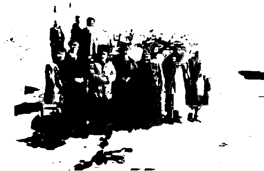
Экспедиция аъзолари Афғонистонда.