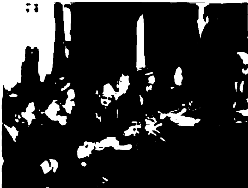
Бобур таваллудининг 510 йиллигини нишонлаш комиссиясининг йиғилиши.