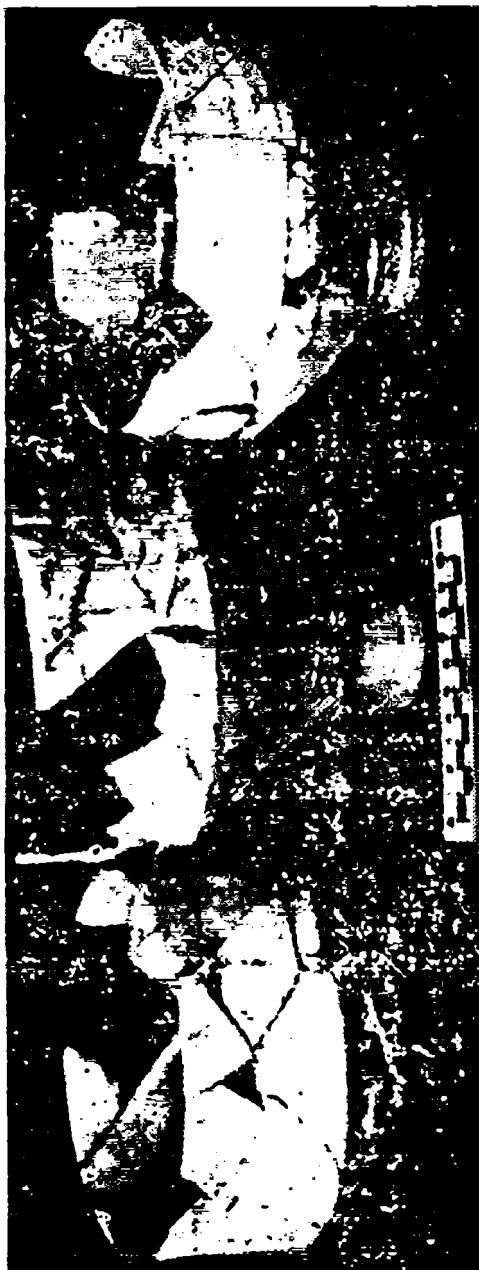
Миллоддан аввалги IV—III асрларга мансуб соно.1 қалаҳлар.