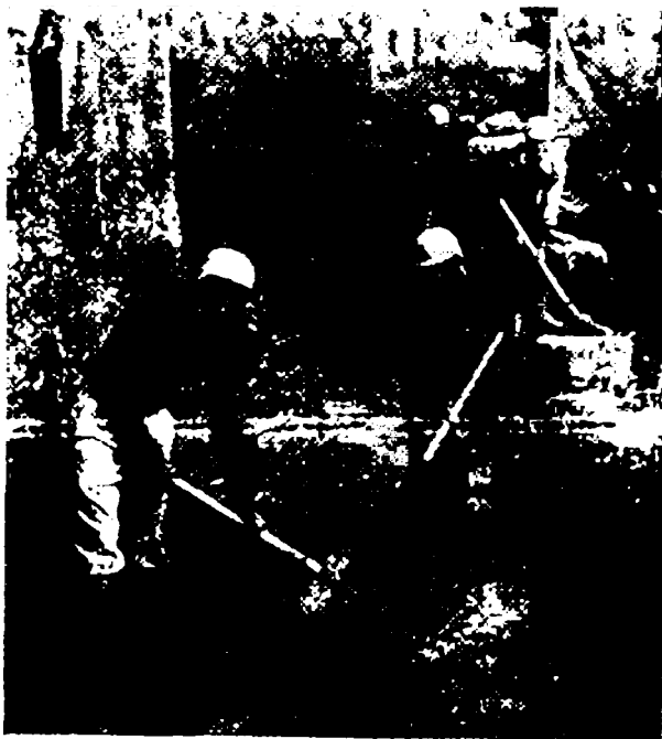
Тоқи Заргарон яқинида. 1974 й.

Бу участкаларда юқори аралаш қатламлар экскаваторлар ёрдамида, остқиси эса фақат белқурак ва кетмонлар воситасида қарийб 20 метр чуқурликда бир нечта улкан хандақлар қазилди, сизиб чиққан ер ости сувлари насослар ёрдамида сўриб олинди. Хандақларнинг лаблари айрим участкаларда ўпирилиб, минглаб тонна тупроқ қазилма майдонларини босиб қолишига қарамай, деярли ҳамма қазилма участкаларида Бухоронинг ботқоқлик устида ҳосил бўлган қадимги руйзаминини қазиб очишга эришилди. Унинг бу она тупроғи устида асрлар давомида баъзи жойларида 14 метр, баъзи участкаларида эса 20 метр қалинликда маданий қатлам вужудга келгани аниқланди. Ундан топилган хилма-хил археологик топилмалар шаҳар ҳаётининг турли тарихий даврларига мансуб бўлиб, улар шаҳарнинг пайдо бўлишидан то асримизнинг бошларига қадар бўлган тадрижий тараққиётини намоён этди.