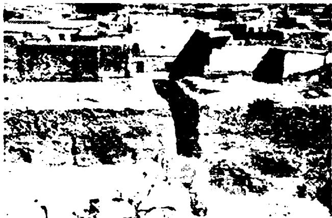
Археологик қазишма. Мирараб мадрасаси яқинида. 1977 й.

Бу тарихий шаҳар рўйнамани остидаги маданий қатламларни кавлаб очиб, унинг қадимий моддий-маданият изларини ўрганишга булган қизиқиш тадқиқотчилар ўртасида қанчалик ортиб бормасин, аммо унинг остки қатламларини қазиб тадқиқ этишга ҳар ким ҳам муяссар бўлавермади.