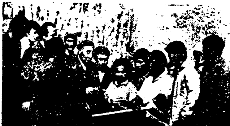
Академик Я. Ғуломов археологик қазиишма иштирокчилари даврасида, 1974 й.

қазииш ишлари шаҳардаги айрим монументал меъморий обидаларни тадқиқ қилиш, уларни таъмир этиш билан боғлиқ эди. Уша вақтларда Мағоки Атторий масжиди яқинида қазиишмалар олиб борган тадқиқотчи В. А. Шишкин ҳам, сўнгра 50-йилларда Миноран Калон пойдеворини қазиб очган археолог С. Н. Юренев ҳам ер ости сувтарини булоқдек қайнаб чиқиши оқибатида шаҳарнинг қадимги саҳнигача кавлаб ета олмаганлар.