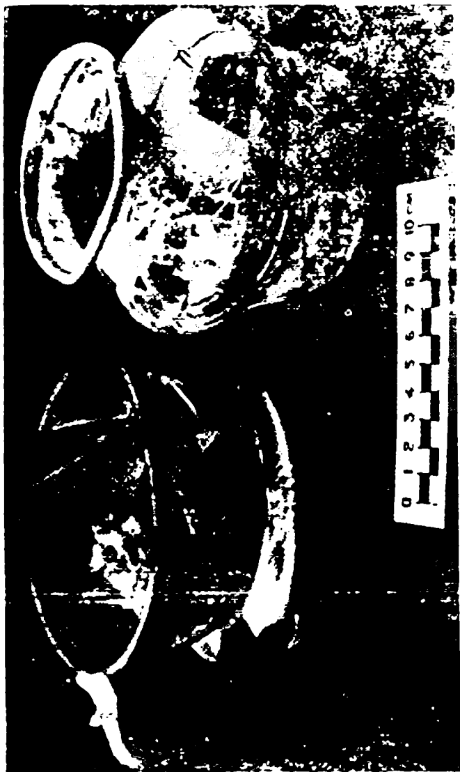
X-XI asrlarga mansub shisha inishlar