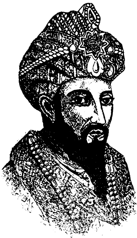
Амӣр Темурнинг бу суврати И.Моредоннинг Хиндистон тарихи китобидан олинди