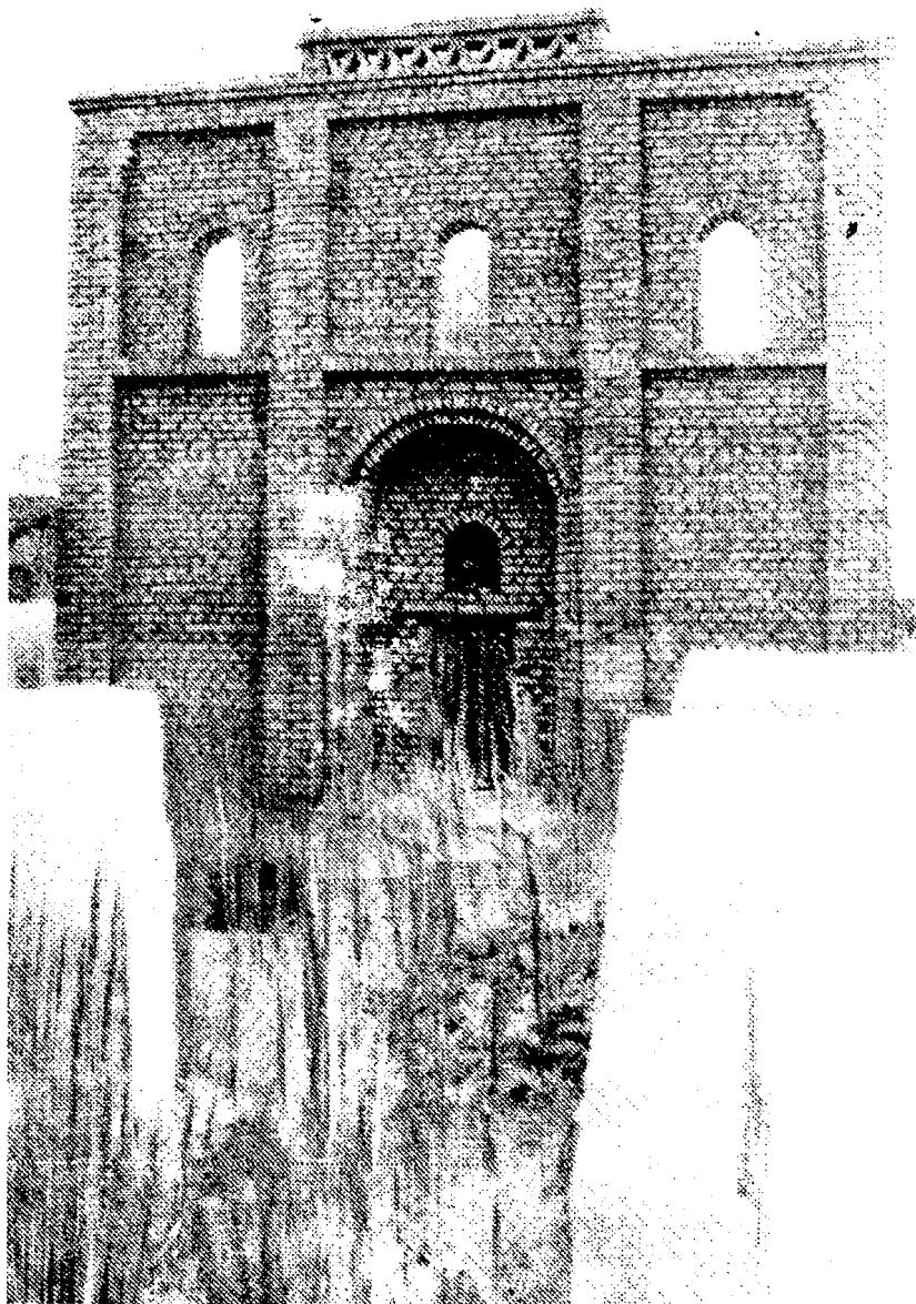
Сайид Мозаддин эшон бобо масжидининг орқа тарafdан кўриниши.