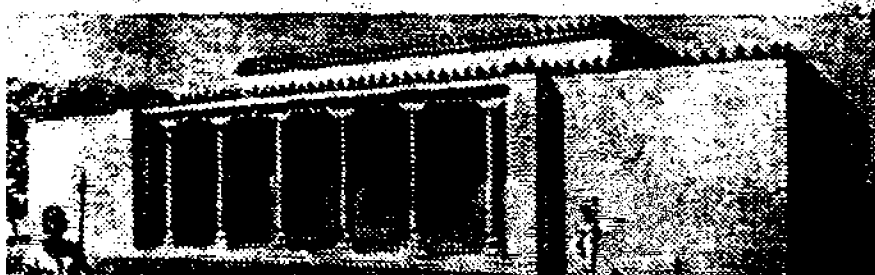
3-раем. Шаҳзода саройи.

Саройни қуришда асосан хом гиштдан фойдаланганлар. Саройнинг томи текис бўлиб, лой сувоқли бўлган. Томнинг қирралари антефикс 1 , пальметта 2 ва кунгура-