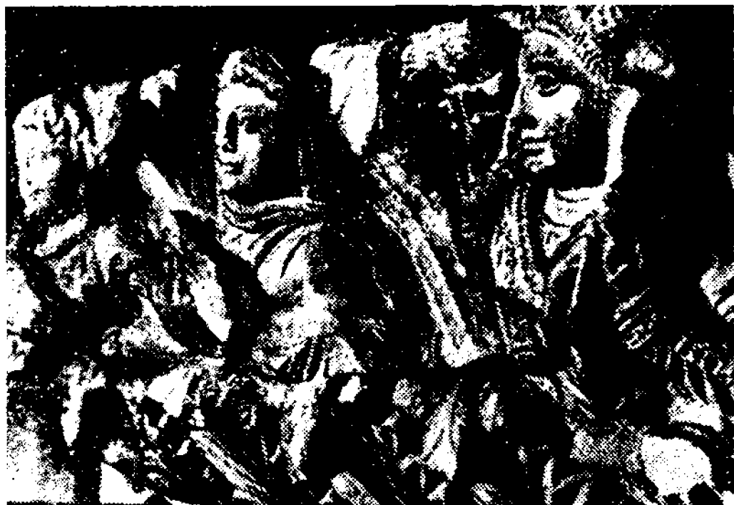
6-расм. Айртондан топилган созандалар ҳайкали.

датхона карнизини безатиб турган уч созанданинг ҳайкаллари (6-расм). Карнизнинг бир томонида юзини сал ўнгга буриб турган ва чилтор чертаётган кулча юзли, кўзлари катта, қошлари туташган, қирра бурунли, лаблари қалли ёш аёлнинг ҳайкали тасвирланган. Аёлнинг эғнида қимматбаҳо кийим, қулоқларида сирға, қўлларида биллакузук, бўйнида маржонлар бор. Торга ўхшаш чолғу асбобини чалаётган иккинчи аёл бироз