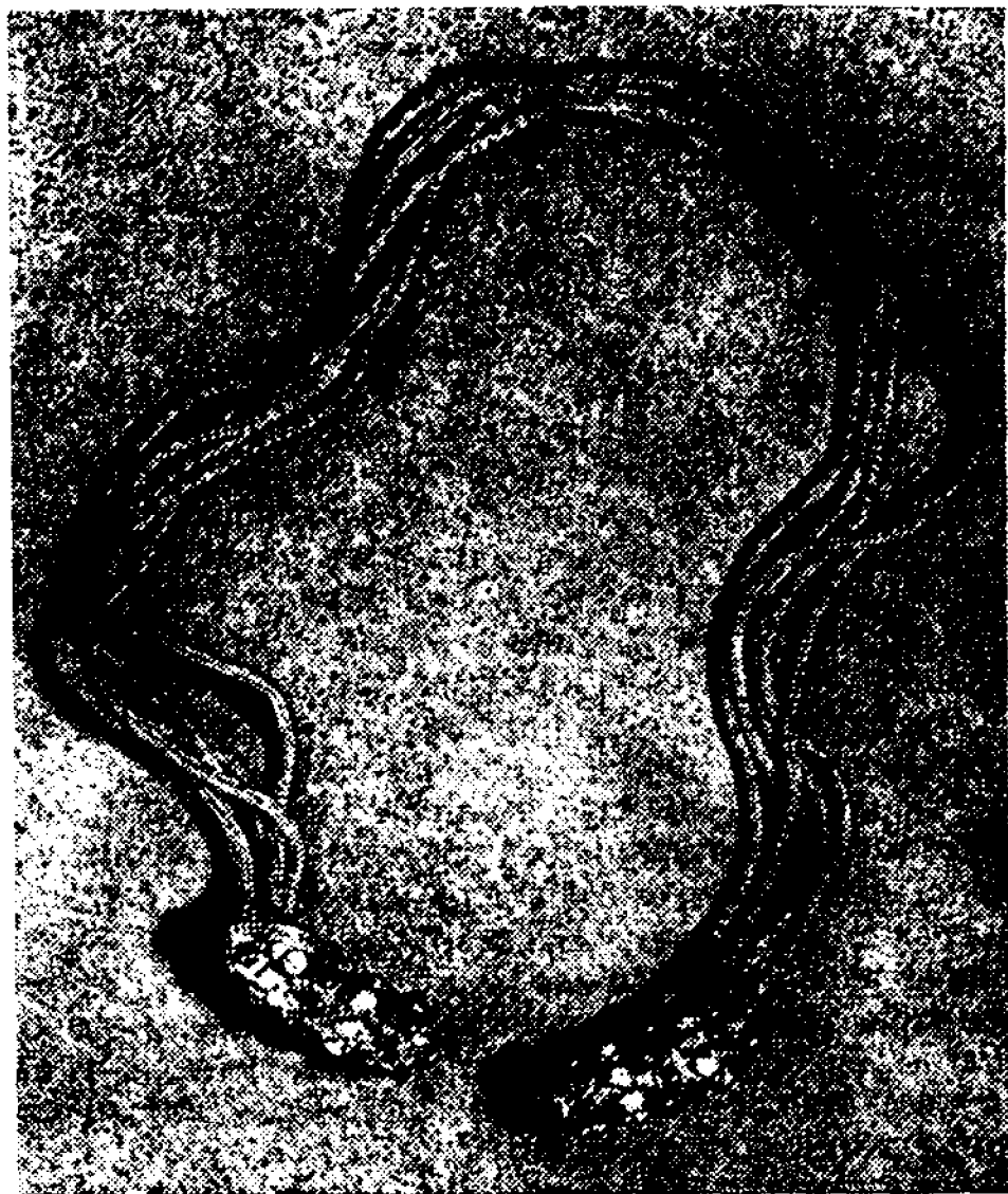
8-расм. Далварзинтепадан топилган олин буюмлардан бири.

ги аниқланди. Далварзинтепадан бир неча километр узоқликдаги кичик тепани текислашайтган тракторчилар хом ёштдан қурилган бинонинг деворларини кўриб қолдилар ва бу тўғрида дарҳол археологларга ха-