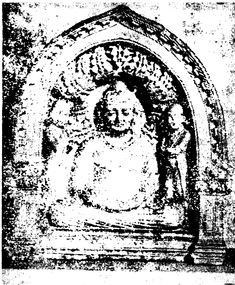
7-расм. Қоратош ибодатхонасидан топилган Будда расми.

ҳар бирида ҳовли бўлган. Ибодатхонанинг марказий қисмидаги комплексида диний маросимлар ўтказилган, шимоли-ғарбий комплекс монастир, учинчи комплекс (жануби-шарқий) эса хўжалик ишларини олиб боришга мўлжалланган. Марказий комплекс ҳовлисининг