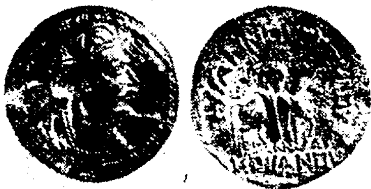
2-расм. Тангаларда тасвирланган шоҳ ҳайкали.

билан битилган тўртта сўз ҳам мавжуд. Биринчи сўз ҳукмрон, иккинчи сўз Герай, учинчи сўз ҳалигача ўқилмаган, тўртинчи сўз кушон деб ўқилади. Шундай қилиб, биринчи гуйшуан-кушон уруғидан бўлган ҳукмроннинг номи бизга маълум бўлди. Лекин, афсуски, ҳалигача Герайнинг қачон ҳукмронлик қилганлиги бизга номаълум. Қўлгина тадқиқотчилар уни милоддан олдинги биринчи асрнинг иккинчи ярмида ҳукмронлик қилган бўлса керак, деб ҳисоблайдилар. Ёзма манбаларда бу тўғрида ҳеч нарса зикр этилмаган. Лекин кушонларнинг Герай ҳукмронлигидан кейинги тақдир ва уларнинг тарих саҳнасига кириб келишлари тўғрисида хи-