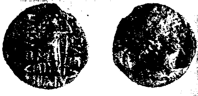
1-расм. Бактрия тангалари.

Шунга кўра бу хилдаги тангалар Сурхондарёда жойлашган бирон-бир шаҳарда, жумладан Далварзинтепа ўрнида бўлган шаҳарда зарб қилинган деб тахмин қилишимизга асос бор. Чунки, тангани фақат бош ҳукмдор зарб қилиши мумкин бўлган. Тахмин қилинишича, бу тангалар кушон — гуйшуан вилоятининг ҳокимлари томонидан зарб қилинган. Бундай деб ҳисоблашга сабаб бор, албатта. Юқорида қайд қилингани-