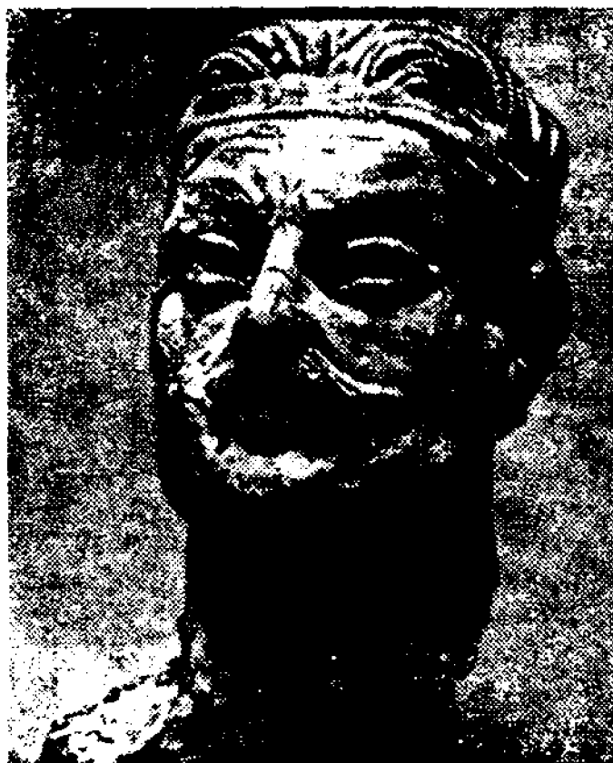
5-расм. Герай уруғларига мансуб ёш йигит ҳайкали.

рон табақасининг эстетик қарашлари, ички дунёси ўзининг ёрқин ифодасини топган. Бу кушонларнинг талаби, эҳтиёжи, қолаверса, замон талаби эди. Холчаён ҳайкалларига сиполик, вазминдорлик хосдир. Уларда инсоннинг ички дунёси чуқур ифодаланган. Масалан, бу ерда топилган жангчи ҳайкалида жангчининг шафқатсизлиги, қаттиққўллиги унинг юз қиёфасидан яққол сезилиб туради. Шунингдек, Герай ҳайкалида Герай продасининг мустаҳкамлиги, улуғлиги яққол акс этган. 5-расмда чўзиқ юзли ёш йигитнинг ҳайкали тасвирлан-