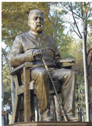
Пайкари С. Айни дар шаҳри Душанбе

Чингиз Айтматов дар бораи Айни навиштааст: «Дар мавҷҳои таърих халқро нишон додан аз ракурси Айни мебошад. Айни бисёр асарҳои хурду калони аҷоиб дорад, ман мутолиакунандагонро барои шинос шудан бо қиссаи ҳаҷвии