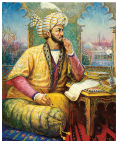
Заҳириддин Муҳаммад Бобур

Арбобони бонуфузи давлатии Мовароуннаҳр таҳти раҳнамоии шайхулислом Абулмақорим Бобур Мирзоро ба ишғол намудани таҳти Самарқанд даъват карданд. Бобур Мирзо ба манфиати сулола содиқ буд, ӯ тирамоҳи соли 1500 ба Самарқанд лашкар кашид ва бори дуюм ба тахт нишаст.