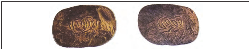
Тангаи мисин. Асри XVI

ба боло бурдани имконияти додани андоз барои деҳқонон, ба афзоиши мулки давлатӣ хизмат кард.