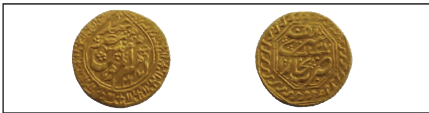
Тангаҳои тиллоии соли 1809 (Хива)

Бино ба ислоҳоти соҳаи андоз доиман чамъ овардани он таъмин шуд. Акнун ҳокимони маҳаллӣ андози заминро чамъ намекарданд, онро амалдороне, ки хон таъин мекард, меғундоштанд. Акнун қисми зиёди андози замин дар шакли пул чамъ карда, ҳамаи он ба хазинаи умумидавлатӣ супурда мешуд. Инчунин ташкили хизмати гумрук ва сикка задани тангаҳои тилло даромади хазинаи давлатро афзоиш дод. Муҳаммад Раҳимхони I дар мамлакат нӯшиданро манъ кард.