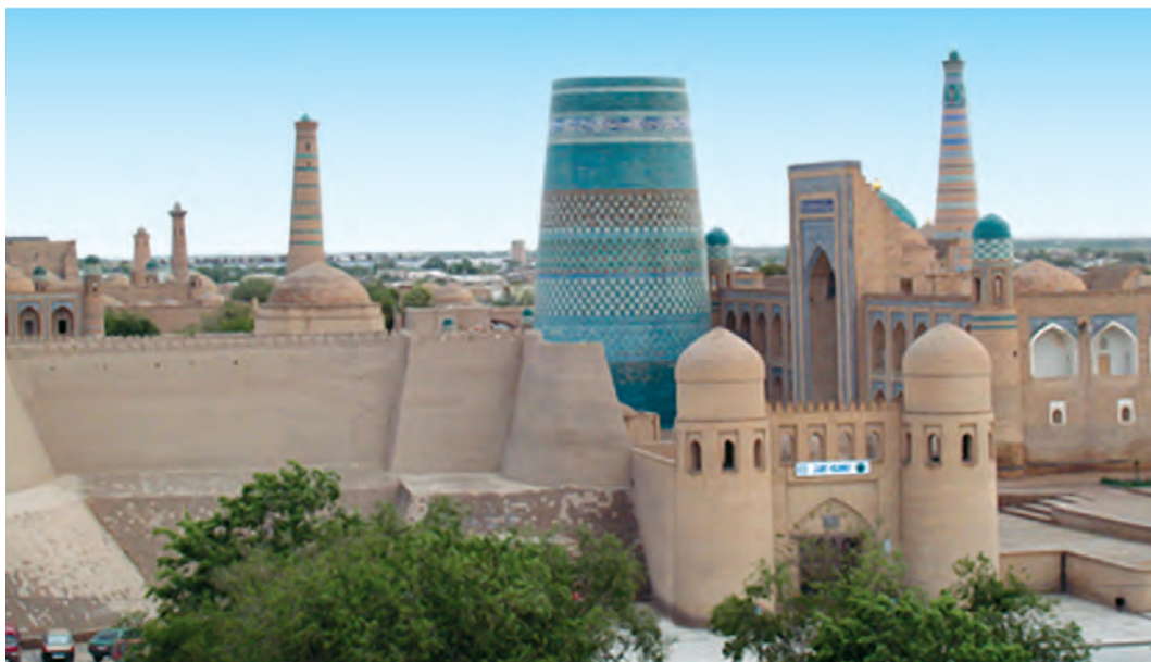
Хива. Ичан қалъа

Ичан қалъа Ичан қалъа ёдгории ноёб ва бузургтарини меъмории Осиёи Миёна, ки аз аҷдодон мондааст, ба шумор меравад. Ичан қалъа қисми дохилии (Шаҳристони) шаҳри Хива аст. Ичан қалъа аз Дишан қалъа бо девор ҷудо карда шудааст. Ба он ба воситаи чор дарвоза– Боғча, Полвон, Тош ва Ота мебароманд. Обидаҳои аҷоибӣ меъмории диёри Хоразм –мадраса, масҷид, қасри хон, биноҳои маъмурӣ, майдони асосӣ ва манораҳо дар дохили Ичан қалъа ҷойгиранд. Дар замони Муҳаммад Раҳимхон, Оллоқулихон ва Муҳаммад Аминхон дар Ичан қалъа қорҳои бузургмиқёси бунёдгарӣ ба амал бароварда шудааст. Қасрҳои мӯхташам, мадраса ва мақбараҳо барпо карда шуданд. Қасри арки Кӯҳна қад қашид. Муҳаммад Аминхон дар шафати Кӯҳна арки қисми ғарбии Ичан қалъа манораи машҳури Қалтаминорро созонд. Ҳангоми сохтани Ичанқалъа меъмори Хива