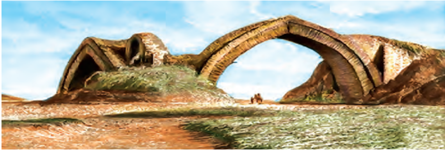
Кўпури болои дарёи Зарафшон—тақсимои об