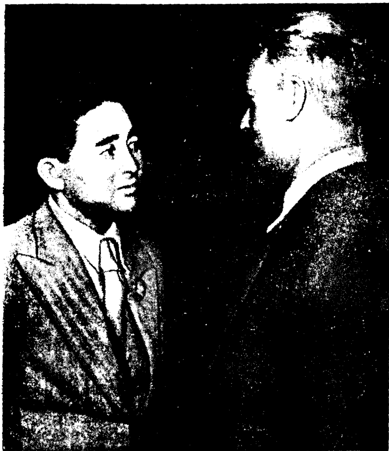
Рис. 3. Хамид Алимджан с А. Фадеевым. 1943 г.

защите Ленинграда и антифашистской поэзии в переводах на узбекский язык.