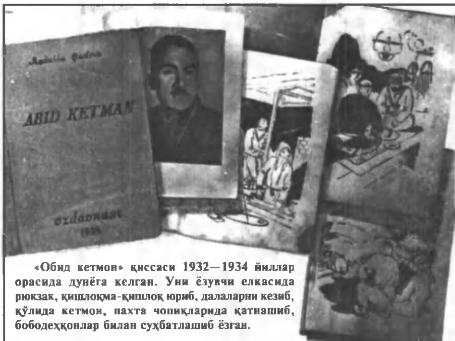
«Обид кетмон» қиссаси 1932—1934 йиллар орасида дунёга келган. Уни ёзувчи елкасида рюкзак, қишлоқма-қишлоқ юриб, далаларни кезиб, қўлида кетмон, пахта чопиқларида қатнашиб, бободехқонлар билан суҳбатлашиб ёзган.