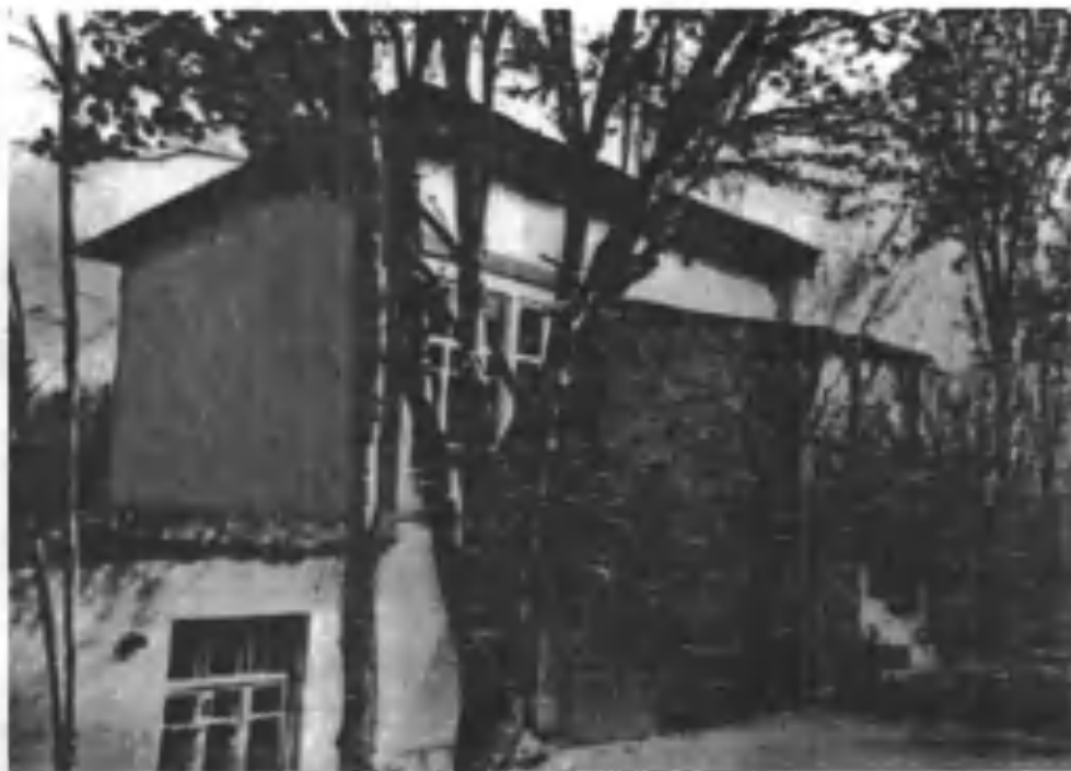
Самарқанд дарбоза маҳалласидаги шийпон ва болахонали уй. Шу ҳовлида «Обид кетмон» қиссаси ёзилди

Дадам беш йил меҳнат қилдилар (Албатта, зарурат бўлганда уста-мардикор ҳам ишлатилди). Қуёш тиғасида оқ қалпоқ, оқ камзул кийиб олиб маҳсичан тепа буздилар, замбилгалтаклаб тупроқ ташиб чуқурларни тўлдириб ер текисладилар. Қайрағоч тўнкаларини қазиб