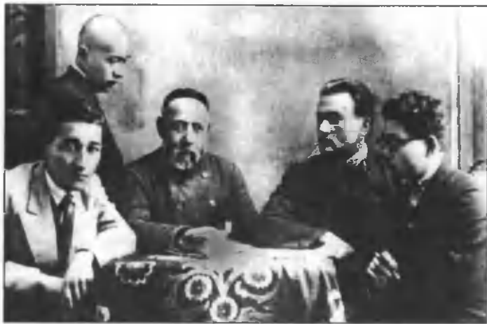
Ўнгдан чапга: Шокир Сулаймон, Абдулла Қодирий, Садриддин Айний, Фафур Гулом ва тожик шоири Абдусалом Деҳотий. 1935 йил