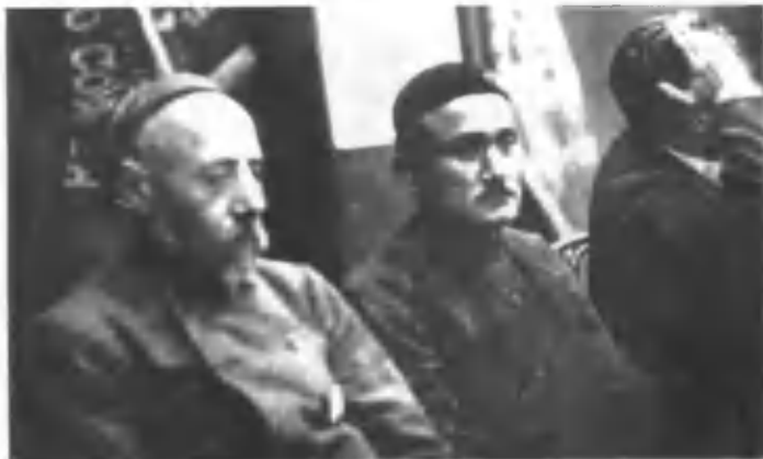
Садриддин Айний ва Абдулла Қодирий Москвада, собиқ Иттифоқ Ёзувчилар уюшмасининг пленумида. 1932 йил

1934 йил ёзида Москвада Бутуниттифоқ ёзувчиларининг биринчи съездини чақириш ва съезд кунлари Иттифоқ халқлари адабиётини кўргазмасини ташкил қилиш белгиланди. Шу муносабат билан Ўзбекистон Ёзувчилар уюшмаси ҳам бошқа республикалар қатори съездга қизгин таёрлик кўрар ва кўргазма ташкил қилиш учун китоблар тўплар, Абдулла акага эса халқ ичидан кўплаб араб-туркий ҳарфда ёзилган эски ўзбек классик китобларини сотиб