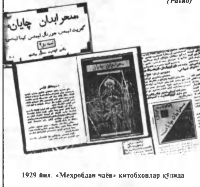
1929 йил. «Меҳробдан чаён» китобхонлар қўлида

учун бу формат ёқмагандек бўлди. Мен эътироз билдирдим.