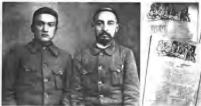
Абдулла Қодирий маҳалладоши Низомиддин мулла Хусайн ўғли билан. Москва, 1925 йил

Абдулла Қодирий 1924 йилнинг ёзида Москвадан «Муштум» журнаliga хатлар ёзиб турди. «Муштум!» Хузурингдан чиқар чоғимда менга берган ваколанинг ҳамон бўйнимда тумордир. Бироқ, сипоришингни қайси йўсун билан бажаришга ҳайронман. Чунки Масковнинг барча ишлари олимпиа, санга ярарлиқ ерини тўтиб бериш қийин: кўз тиниб бош айланган, мия ишламайди... Сўзни нимадан бошлаб ёзишга ҳайронман: «Масковнинг мирзақирон чиллакилари»нинг савдоси билан умргузаронлиқ қилғучи баъзи бир ўқу-ғучиларимизнинг «бири бит, бити сирка» бўлмаганидан ёзайми, ундан бунга савдо-сотик учун келиб, қайёқдаги тутуриқсиз шилинпоча гўзаллардан шатта еб Масков кўчаларида саланглашиб юрган коммерсант акаларимизнинг ҳаётиндан ёзайми? Ҳар ҳолда миям ўзимга келгунча кутиб турчи...»