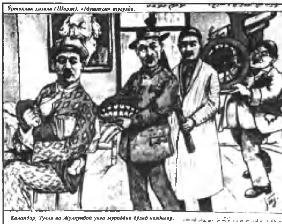
Уртоқлик ҳазми (Шарҳ). «Муштум» тугуади.

Шундай қилиб, Қодирийнинг машҳур «Калвак маҳзуннинг хотира дафтари»дан, «Тошпўлат тажанг нима дейди?», «Шарвон хола нима дейди?», «Эшонларимиз», «Тошканд бойлари» каби қатор ҳажвий асарлар туркуми яратила бошлайдики, бу асарларни «Муштум»хонлар писанд қиладилар, завқ билан ўқийдилар, давомини кутадилар. Шу йўсин «Муштум» журнали «қизийди», ўқувчилар сони оша боради, нусхаси