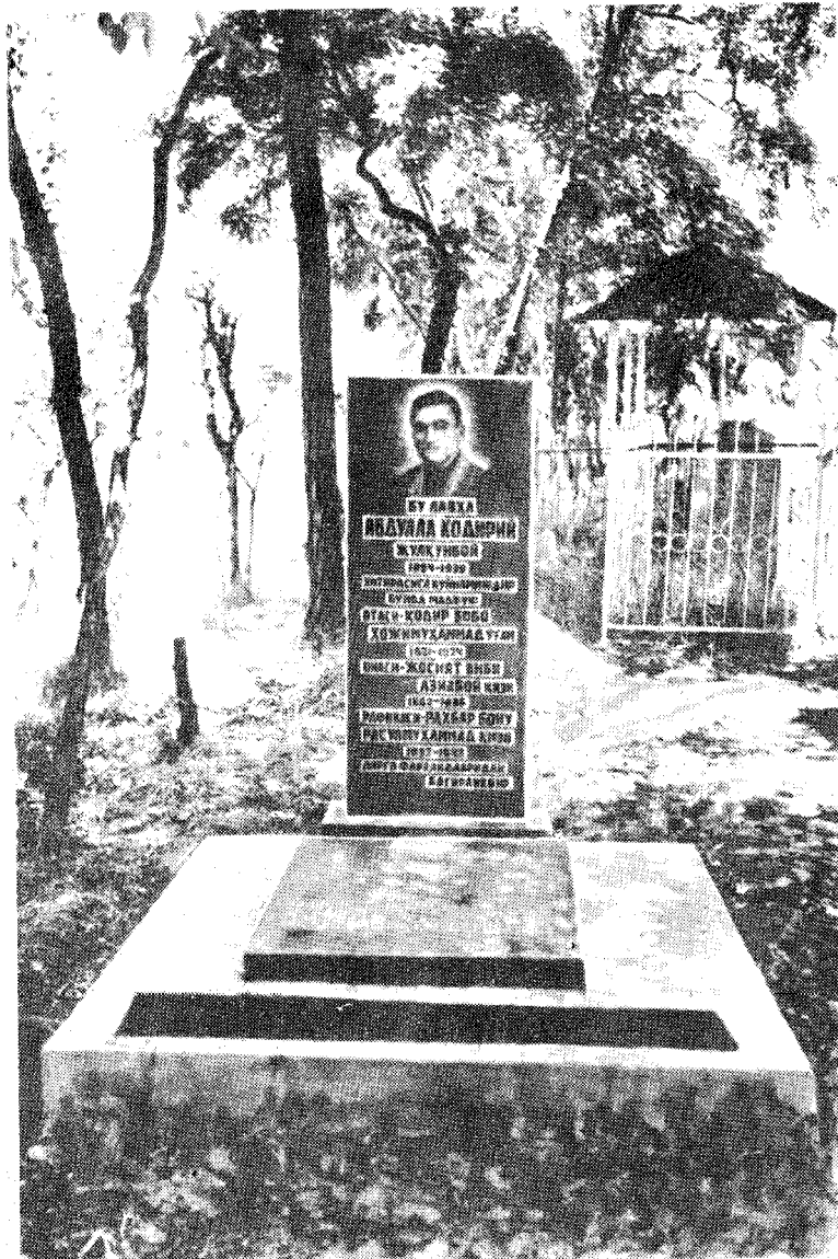
Тошкент шаҳри. Камолон қабростони, Қодирийнинг рамзий кабри.