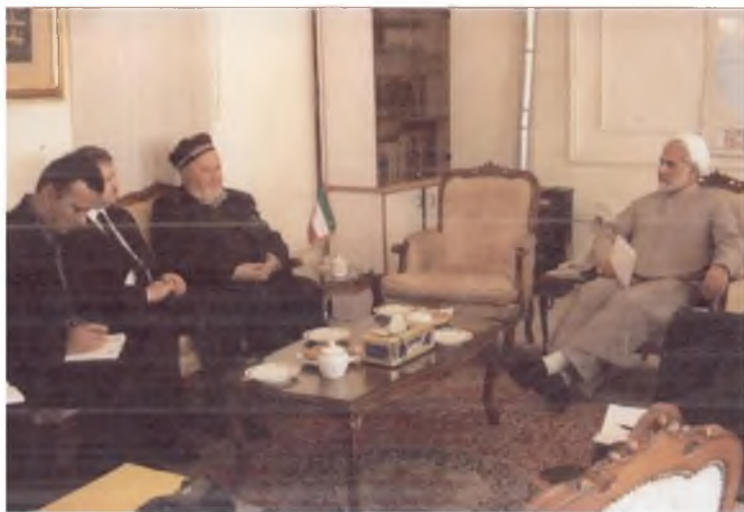
Техрон музейида «Куллиёти Бобур»дан нусха олиш юзасидан музокара. 2004 йил.