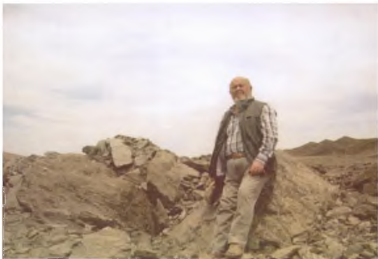
Геологик изланишлар давом этади.