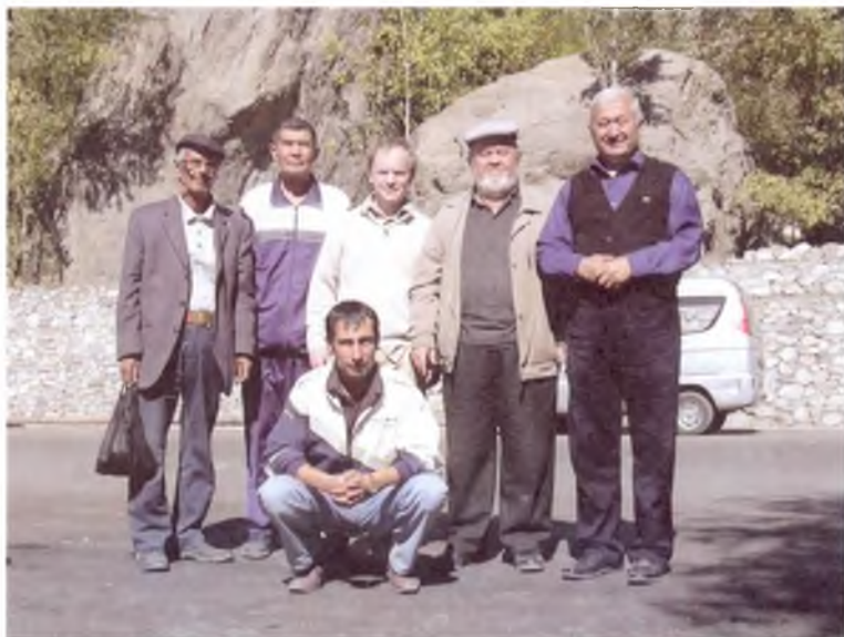
Бобур номли халқаро экспедиция Хоруғ шаҳрида. 2009 йил.