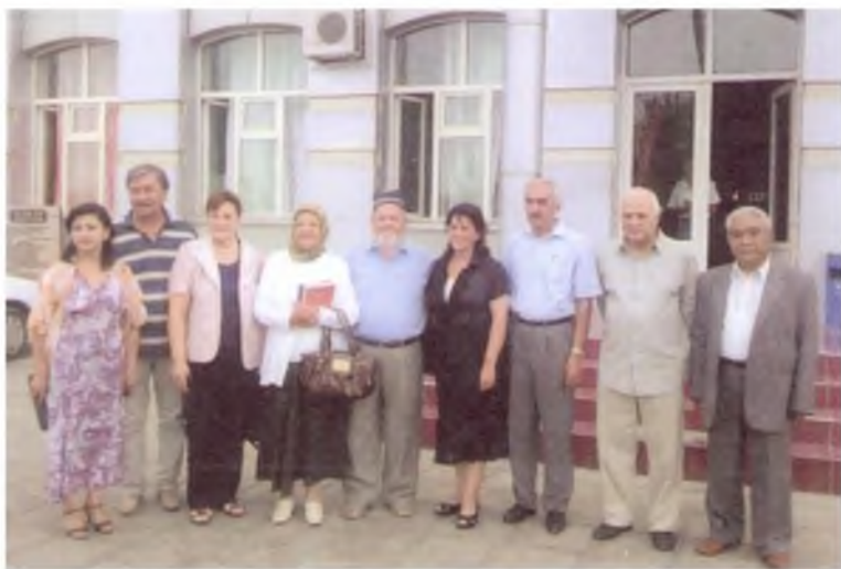
Заҳириддин Муҳаммад Бобурнинг 525 йиллик тантаналари. 2008 йил.