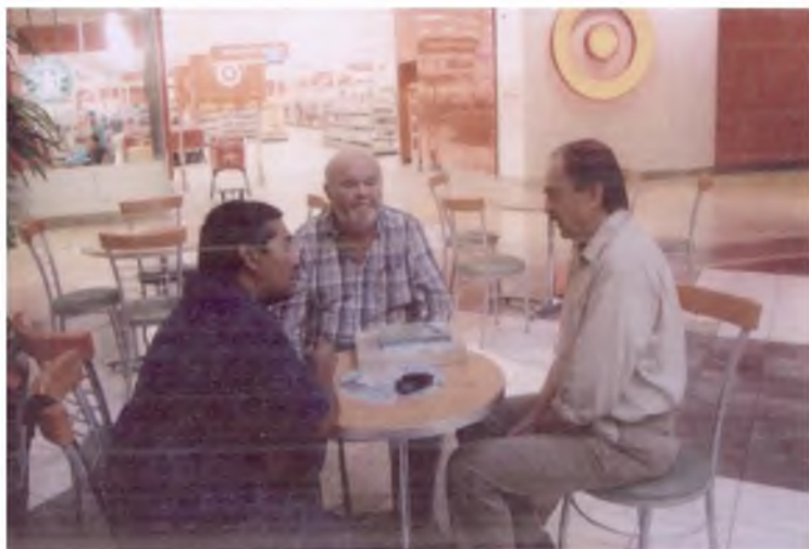
Таниқли бобуршунос Степан Дейл билан Индиана университетида учрашув. 2009 йил.