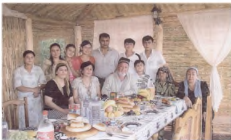
Файзли хонадон. 2007 йил.