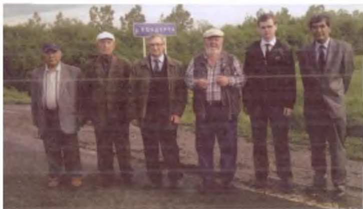
Самара. Кондурча дарёси соҳили. Россиялик олимлар билан. 2010 йил.