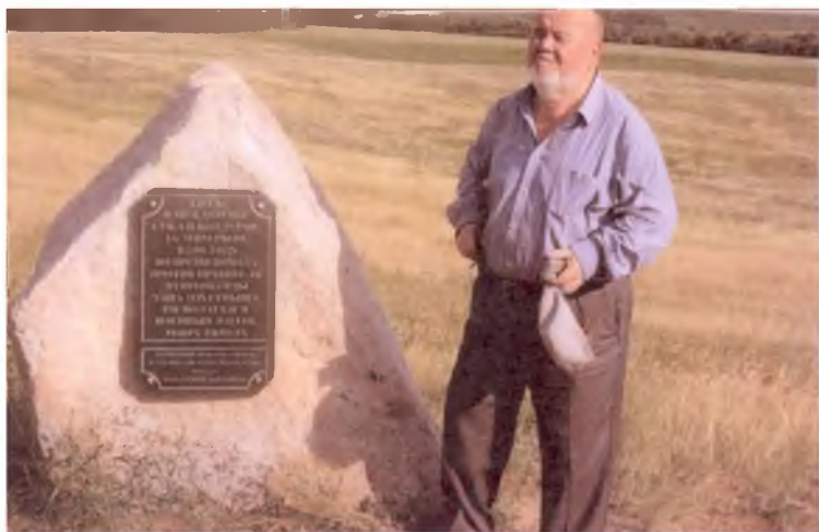
Самара. Бу ерда Амир Темуր ва Тўхтамиш ўртасида 1391 йили кескин жанг бўлиб ўтган.