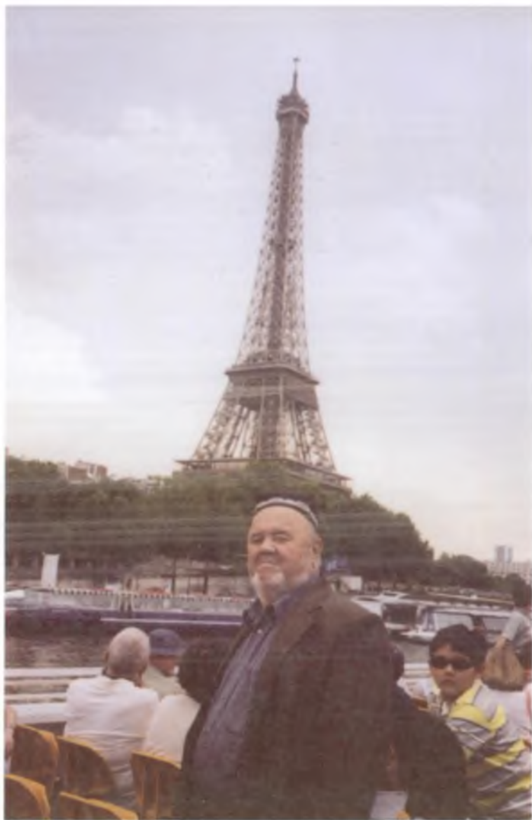
Париж сафарида. 2003 йил.