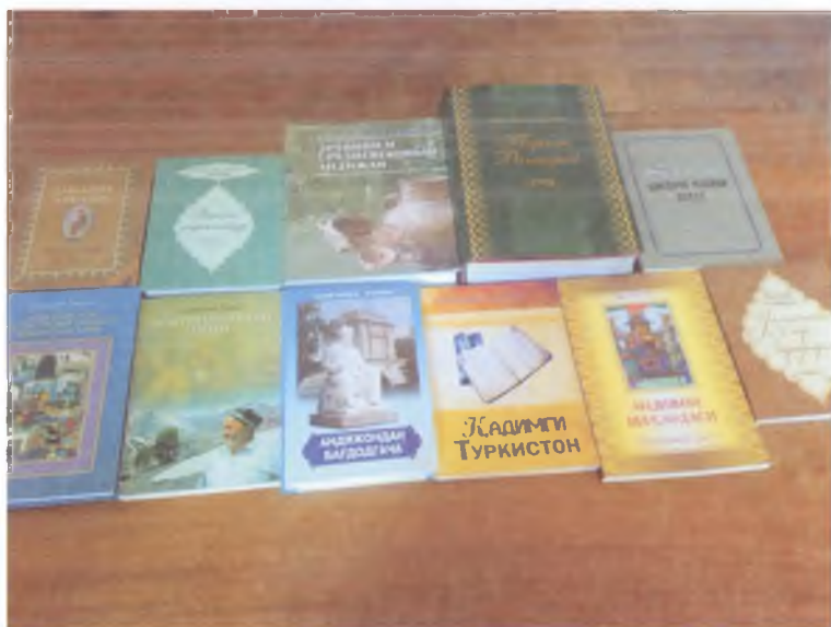
Бобур номли Халқаро жамоат фонди буюртмаси ва ҳомийлигида нашр этилган асарлардан намуналар.