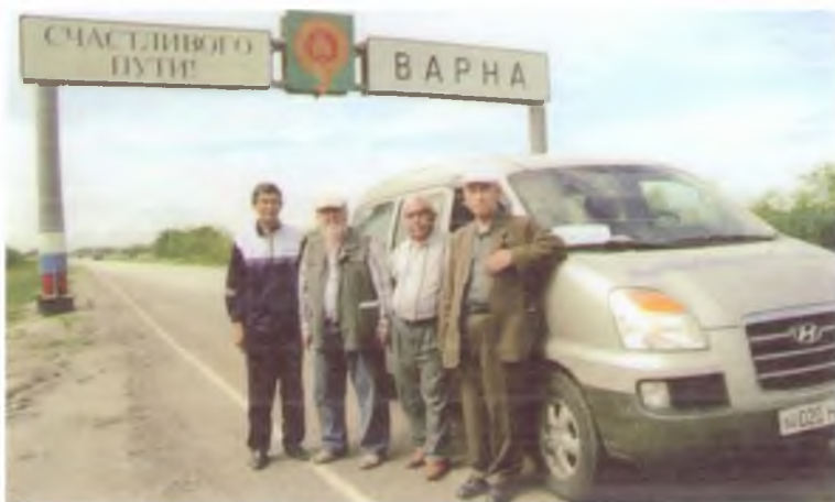
Челябинск вилояти Варна шахри дарвозаси. Дарвоза пештокида шу шаҳар рамзи – Амир Темур минораси. 2010 йил.