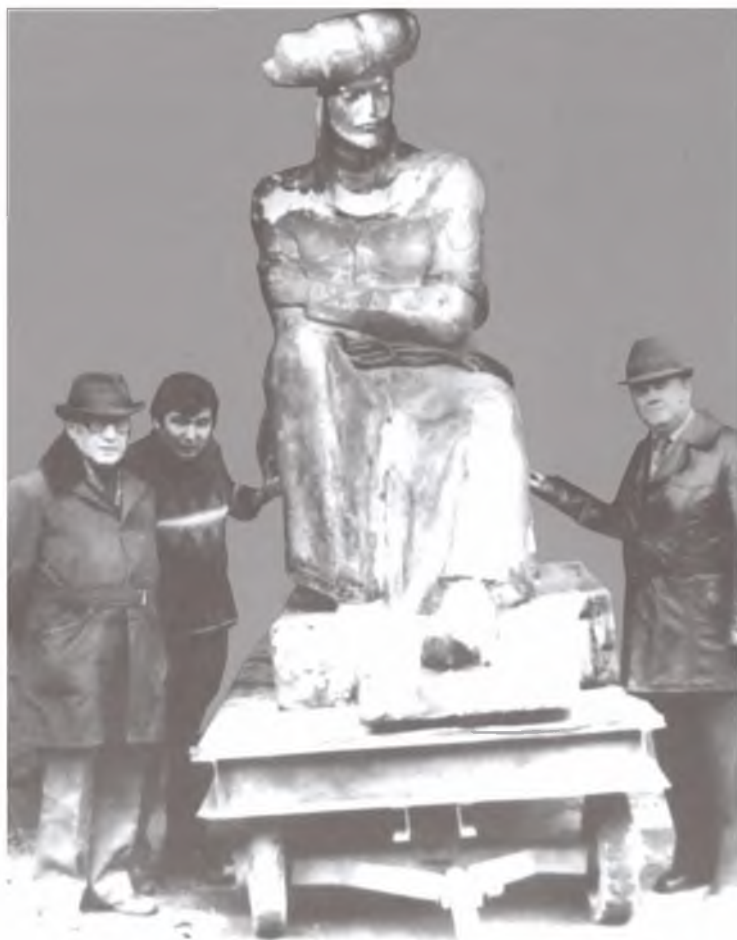
Москвадаги Митищи шаҳрида бронзадан қуйилган Бобур ҳайкали тайёр бўлди. 1984 йил.