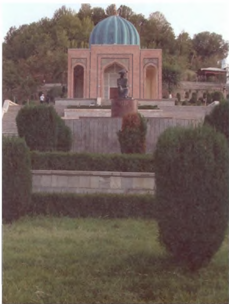
Андижон. Бобур боғи. 2010 йил.