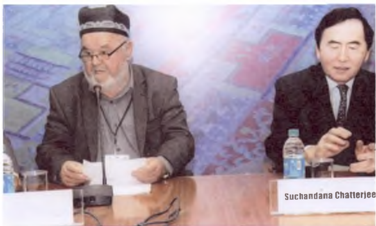
Деҳли. Халқаро анжуманда, 2012 йил.