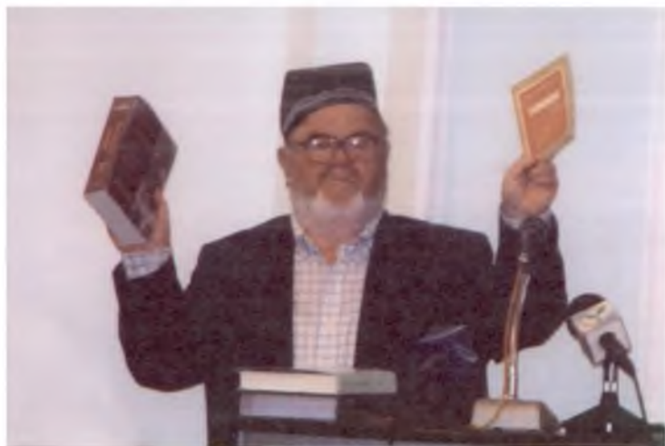
Америкадан келтирилган Бобур ҳақидаги китоблар тақдимоти. 2009 йил.