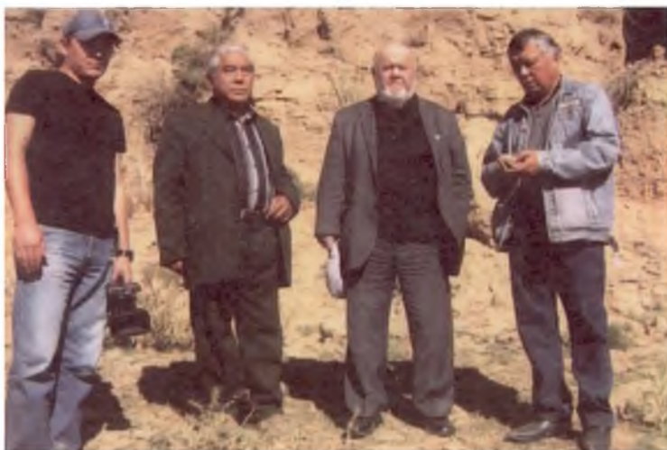
Астрахань. Олтин Ўрданинг қадимий шаҳарларидан бири. 2012 йил.