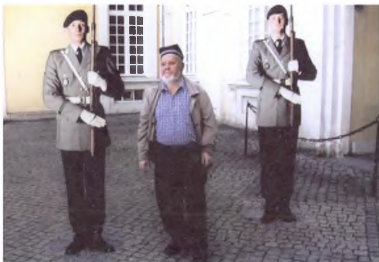
Германиядаги Дрезден музейида. 2004 йил.