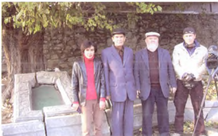
Кашмир Сринагар. Зайнулобиддин мазороти. Муҳаммад Ҳайдар мирзо қабри олдида. 2009 йил.