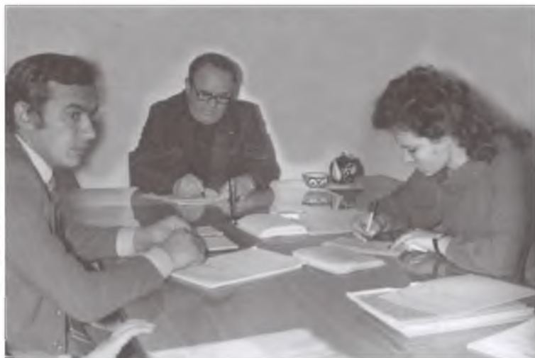
Андижон шаҳар ижроия қўмитаси. Иш жараёни. 1983 йил.