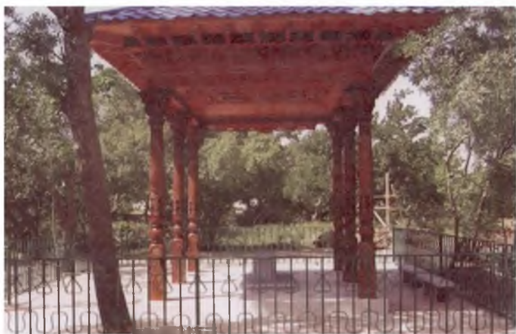
Ўирот яқинидаги Нангобод (собик Деҳи Канор) кишлоғида Бобур халқаро жамғармаси томонидан Мавлоно Лутфийга қўйилган қабртош ва мақбара. 2007 йил.