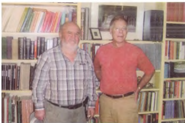
АҚШ. Гарвард университети профессори Уилер Текстоннинг иш кабинетида. 2009 йил.