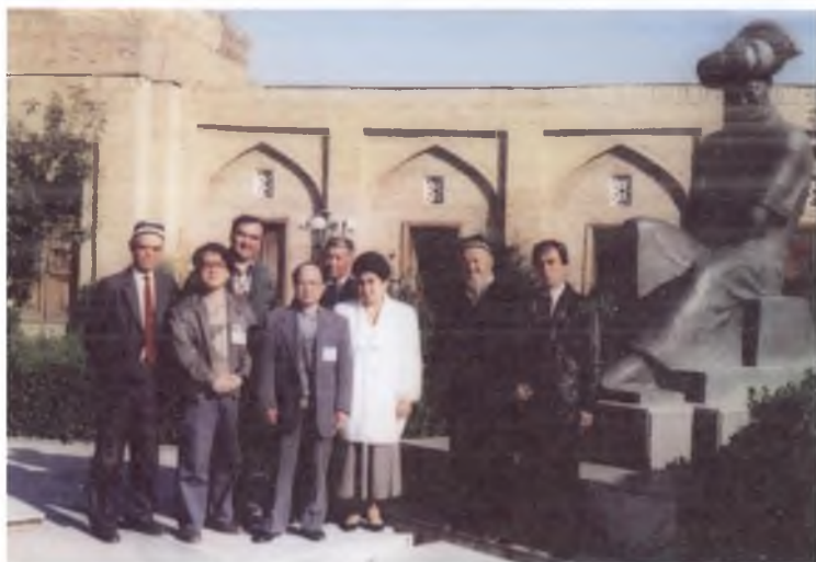
Таникли бобуршунос Эйжи Манонинг илк мартаба Андижон шаҳридаги Бобур уй-музейига ташрифи. 2002 йил.