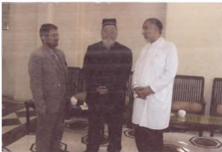
Машҳад шаҳридаги Имом Ризо мажмуаси раҳбарлари билан «Хатти Бобурий»да ёзилган Қуръон нусхасини олиш юзасидан музокара. 2005 йил.