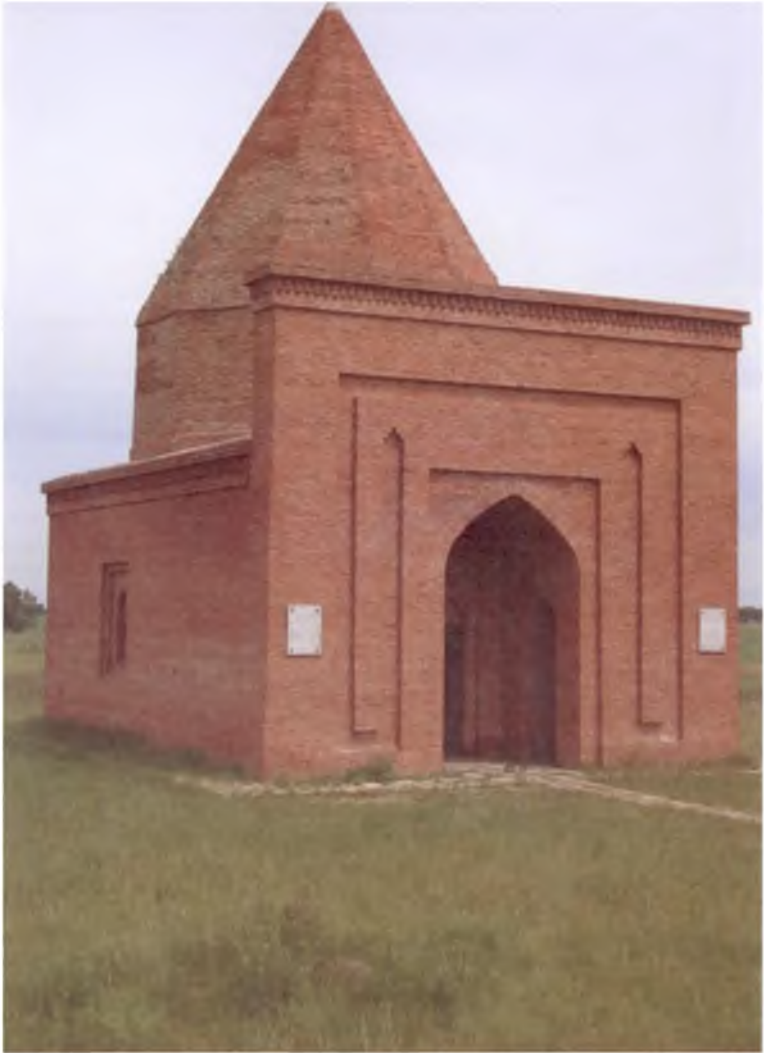
Челябинск вилояти Варна шаҳри. Амир Темур минораси. 2010 йил.