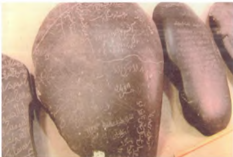
Машҳур Бобур тошбитиги: «Эшитганим борки...». 2009 йил.