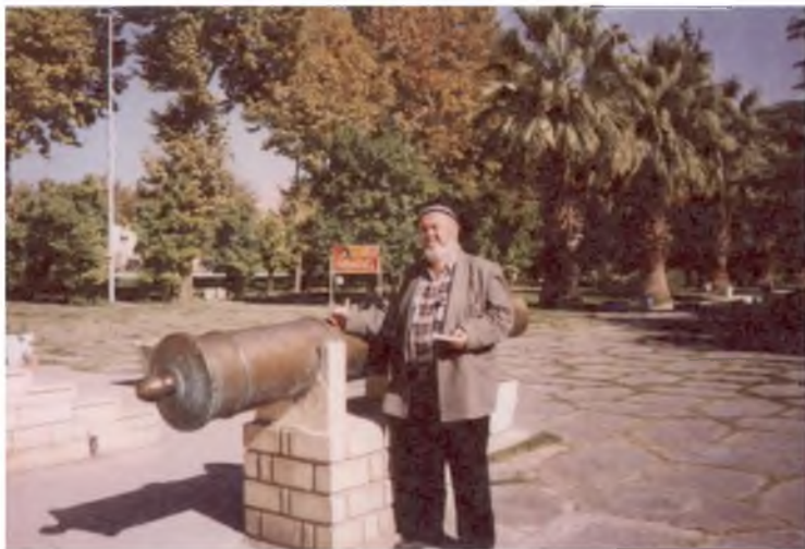
Дакка. Бобур замбараги. 2006 йил.