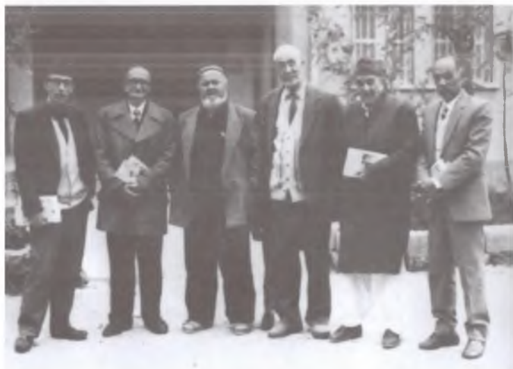
Хорижий бобуршунослар билан учрашув. 2000 йил.