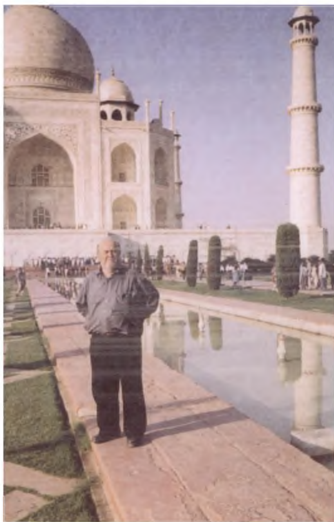
Агра. Тож Маҳал. 2006 йил.