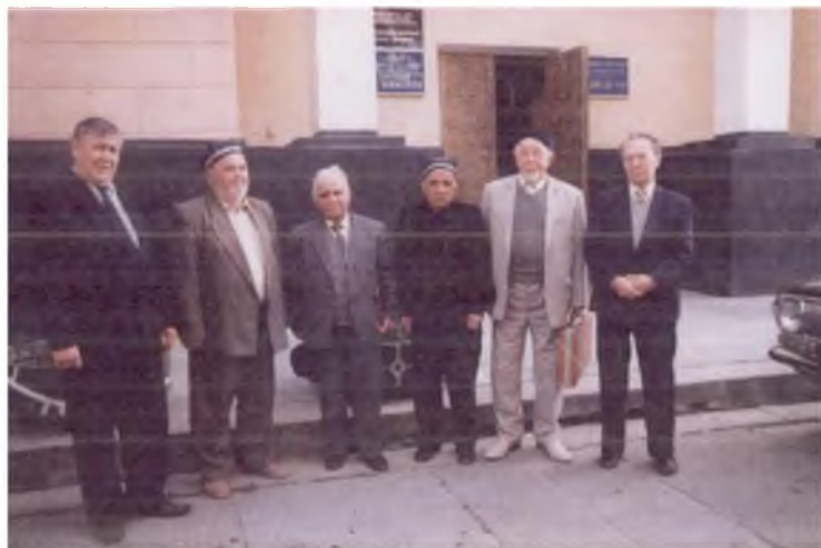
Ўзбекистонлик машҳур адиб ва олимлар даврасида. 2002 йил.