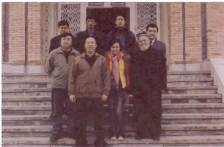
Хитойлик археологлар билан учрашув. 2011 йил.