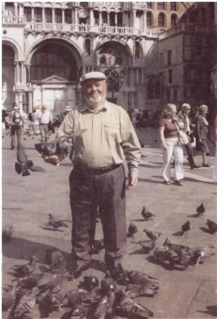
Рим шаҳрида. 2009 йил.