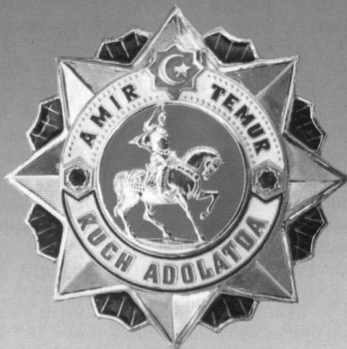
«Амир Темур» ордени