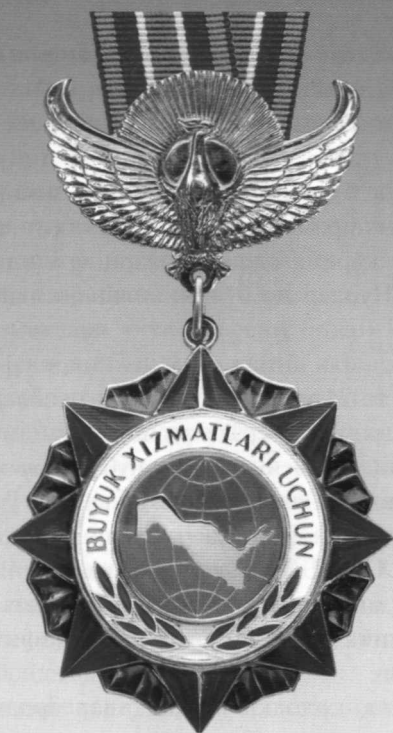
«Буюк хизматлари учун» ордени