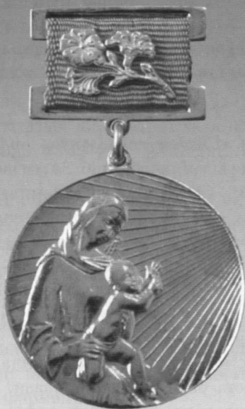
I даражали «Соғлом авлод учун» ордени