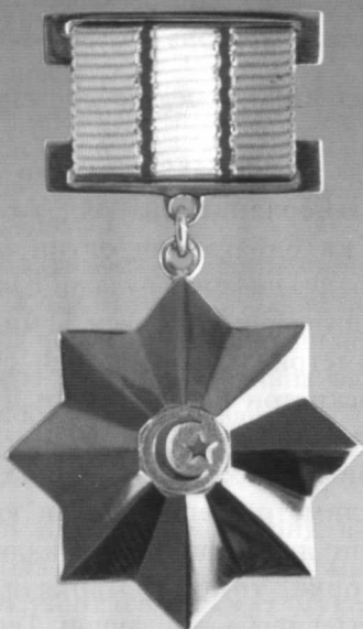
«Олтин Юлдуз» медали