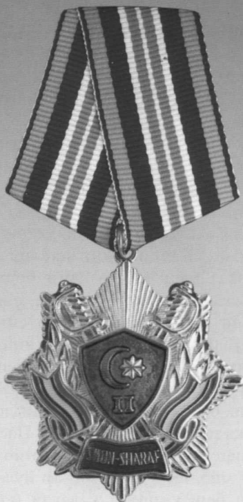
II даражали «Шон-шараф» ордени