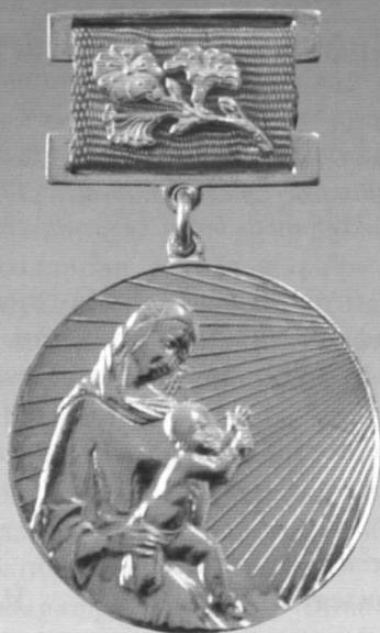
II даражали «Соғлом авлод учун» ордени