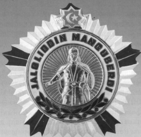
«Жалолиддин Мангуберди» ордени