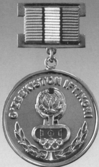
«Ўзбекистон ифтихори» фахрий унвони кўкрак нишони