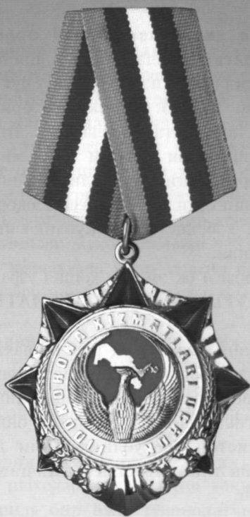
«Фидокорона хизматлари учун» ордени