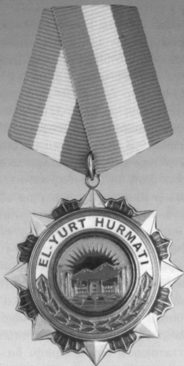
«Эл-юрт ҳурмати» ордени