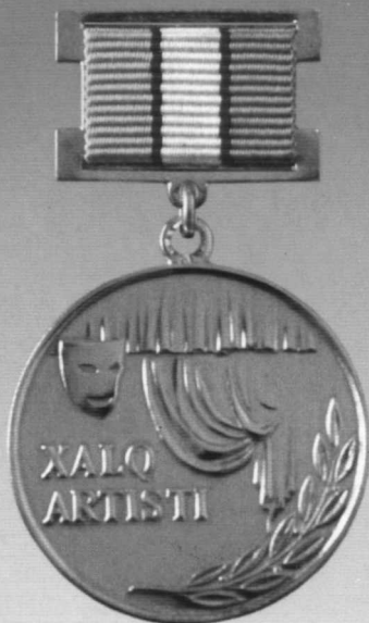
«Ўзбекистон Республикаси халқ артисти» фахрий унвони кўкрак нишони