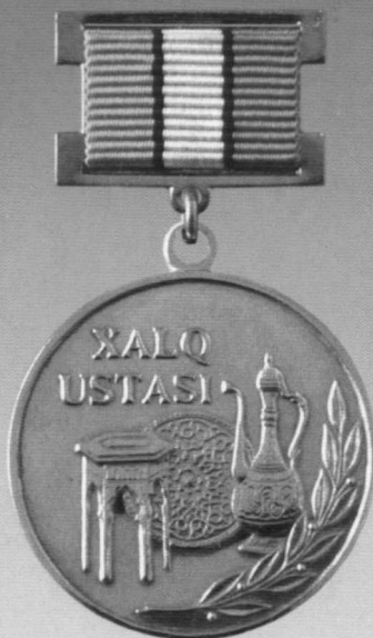
«Ўзбекистон Республикаси халқ устаси» фахрий унвони кўкрак нишони