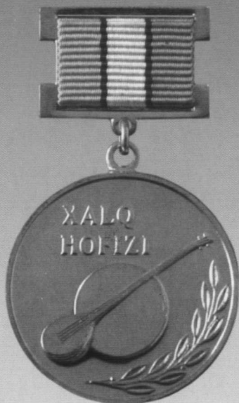
«Ўзбекистон Республикаси халқ ҳофизи» фахрий унвони кўкрак нишони