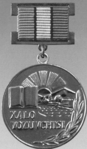
«Ўзбекистон Республикаси халқ ёзувчиси» фахрий унвони кўкрак нишони