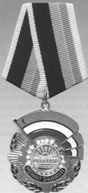
«Меҳнат шухрати» ордени