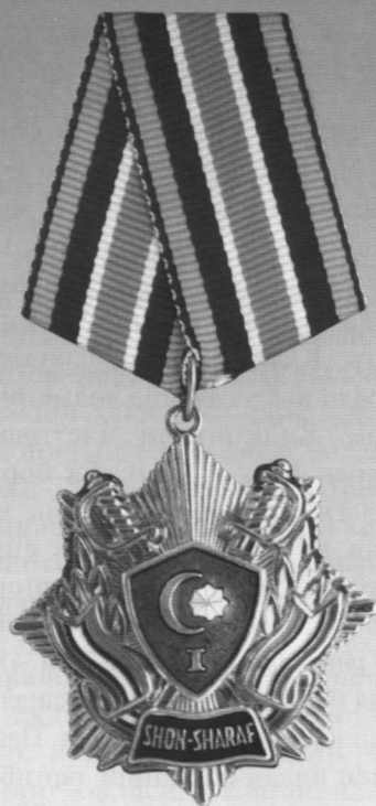
I даражали «Шон-шараф» ордени