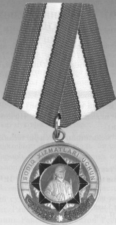
«Содиқ хизматлари учун» медали