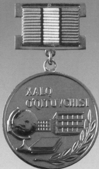
«Ўзбекистон Республикаси халқ ўқитувчиси» фахрий унвони кўкрак нишони