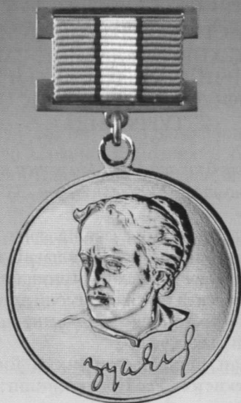
Зулфия номидаги Давлат мукофоти