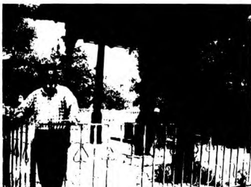
Афғонистон. Деҳи Канор қишлоғи. Мавлоно Лутфий қабр-мақбараси.