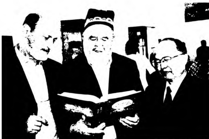
Таниқли бобуршунослар — япон олими Эйжи Мано ҳамда озарбайжонлик Рамиз Аскер билан.