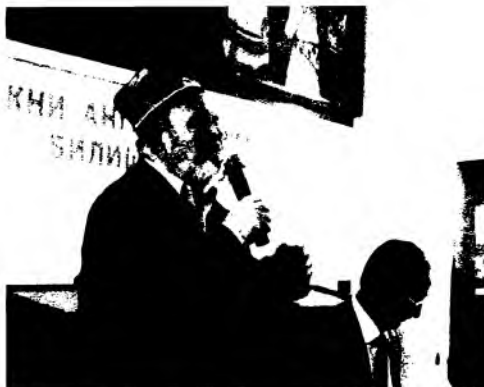
Бобур таваллудининг 525 йиллигига бағишланган халқаро конференцияда.