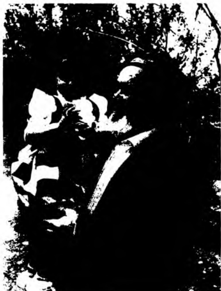
Ўригидан мағизи ширин...