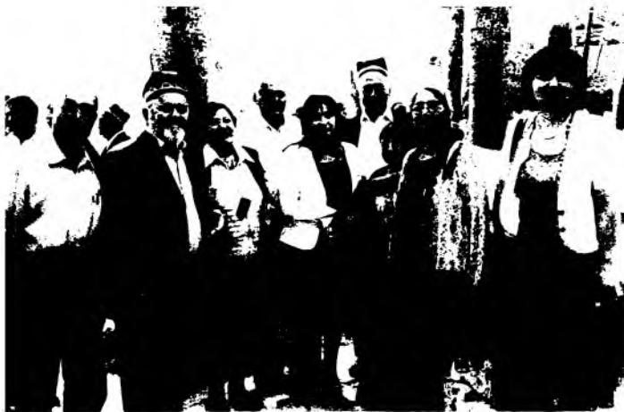
Андижондаги Бобур кунларига бағишланган маданий тадбирлардан бирида.