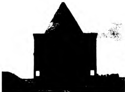
Россиянинг Варна туманида жойлашган Амир Темур минораси.