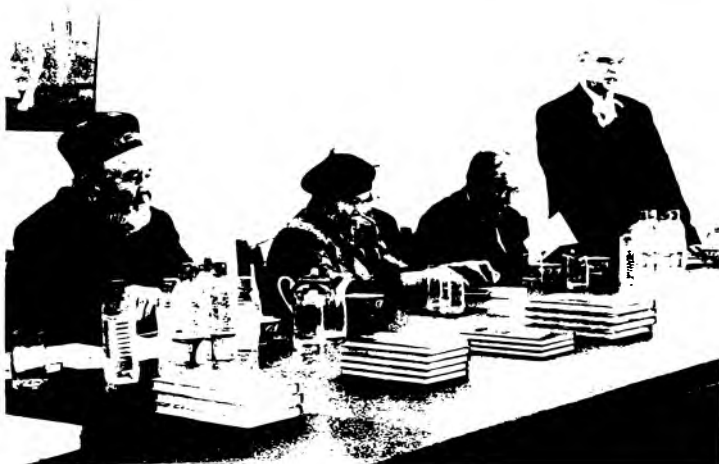
Янги нашр этилган Бобур мавзуйдаги китоблар муҳокамаси.