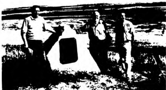
Россия.Красний Яр тумани. Амир Темур лашкароҳига ўрнатилган ёдгорлик тоши.