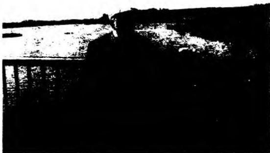
Қозоғистон.Тобул дарёси бўйида.