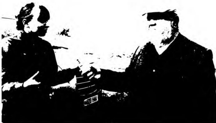
Экспедиция, 2012 йил, октябрь. Волгоград вилояти (Россия). Дубовка шаҳри четидаги қадимги Белжамин, ҳозирги Водян археологик ёдгорлик жойи.