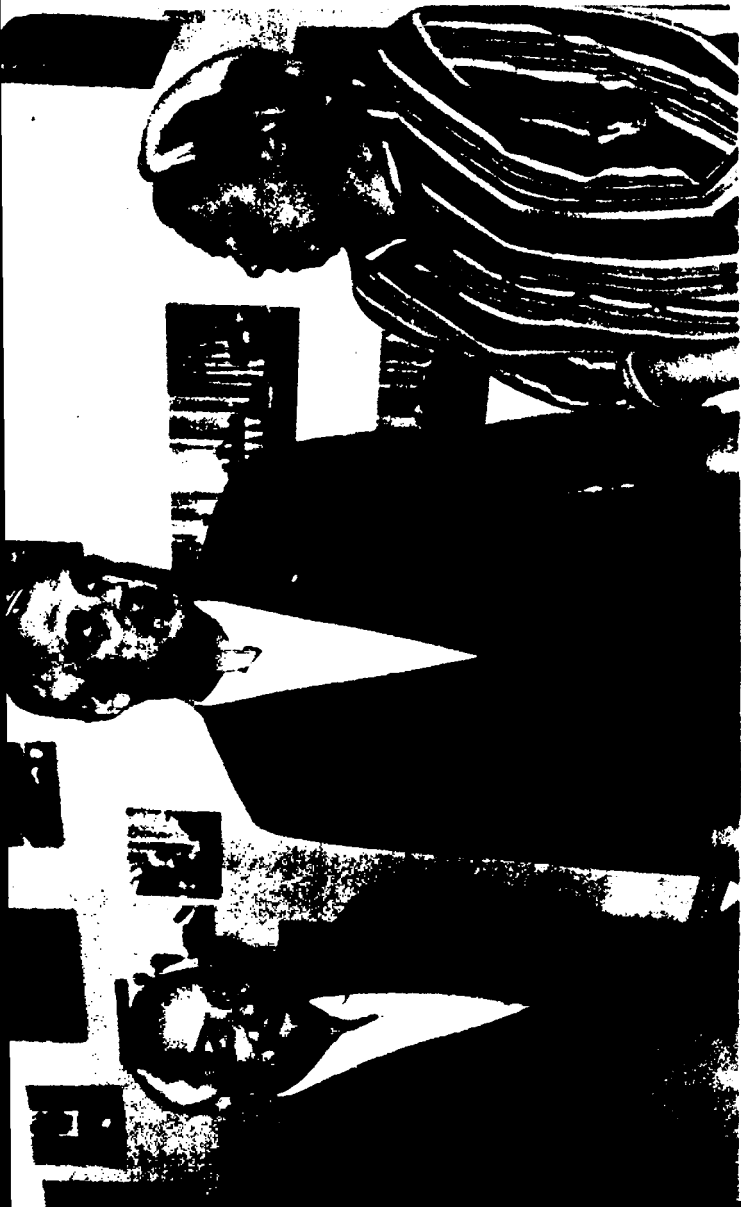
Абдулла Қаҳҳор С. Михалков ва А. Барто билан.