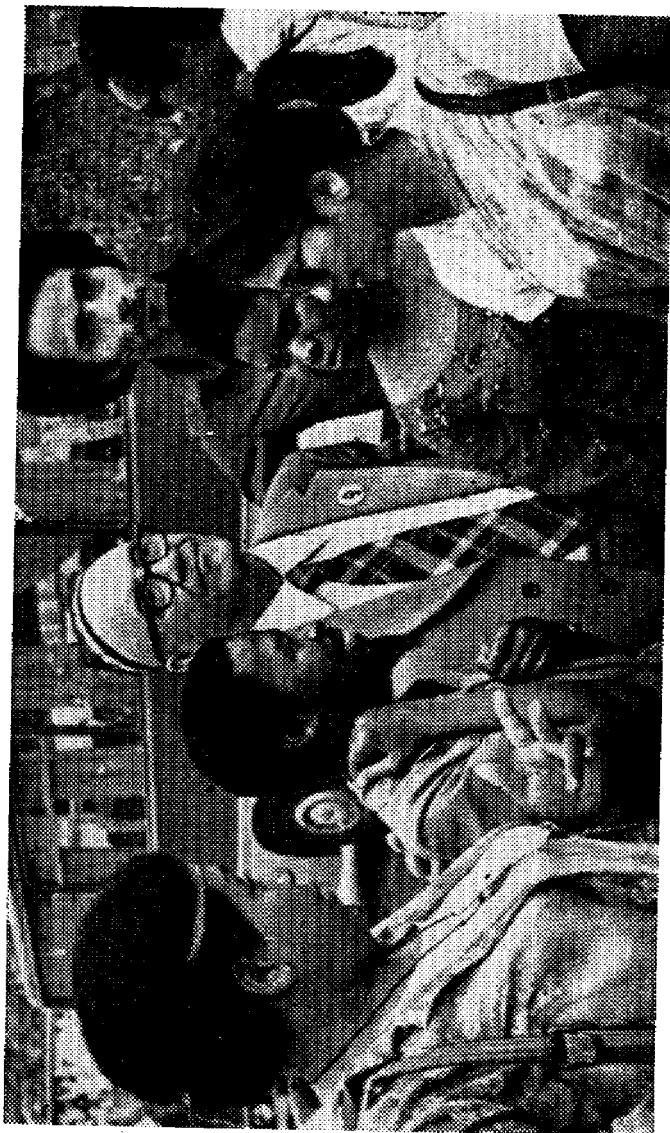
Ҳаким Назир Оснэ ва Африка мамлакатлари ёш ёзувчиларининг Тошкенда бўлган учрашуви иштироқчилари орасида (1976 йил, сентябрь)