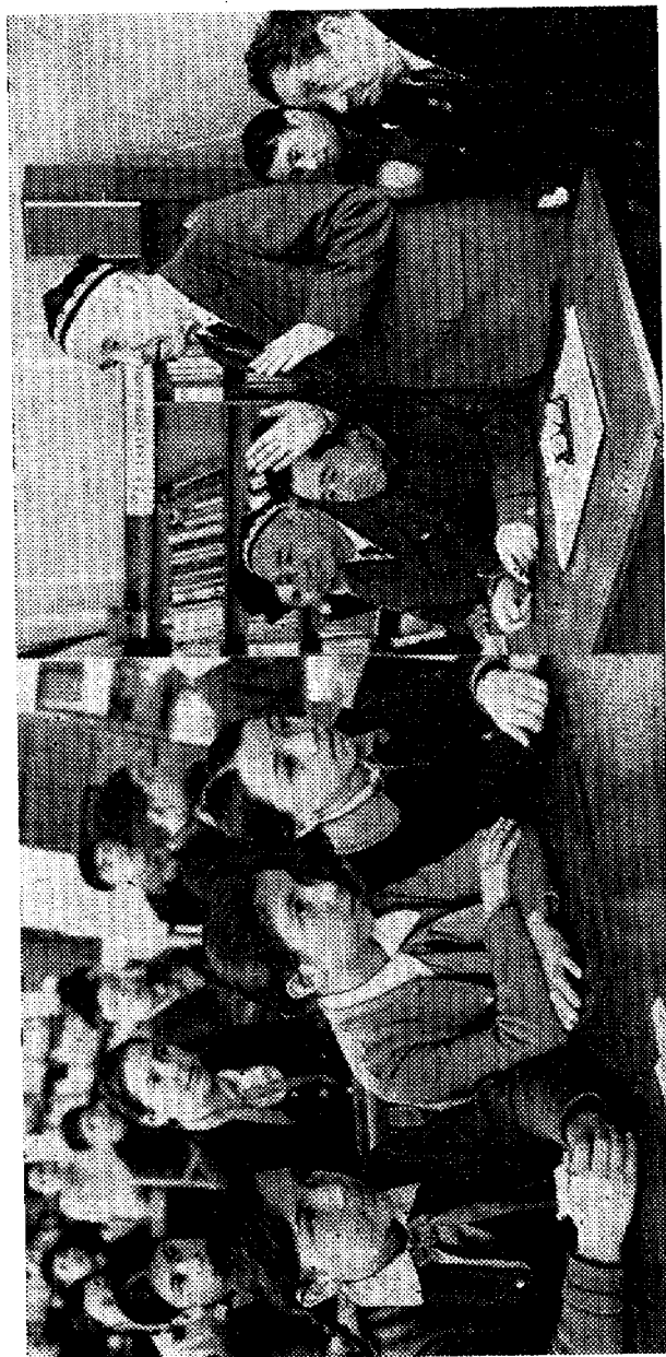
Тошкентдаги республика марказий болалар кутубхонасида болалар ёзувчилари билан учрашув. Ҳаким Назир ёш китобхонлар билан суҳбатлашмоқда. (1977 йил, март)